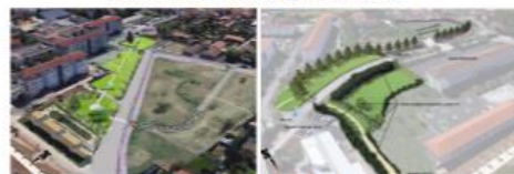
Ilot Dumont d'Urville