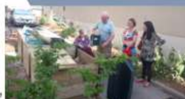
IAA Clos Jules Verne