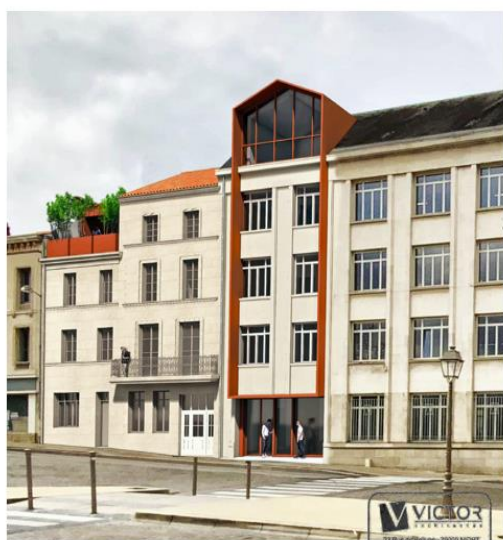
Niort Tech – Présentation du projet – Avenue Buiault