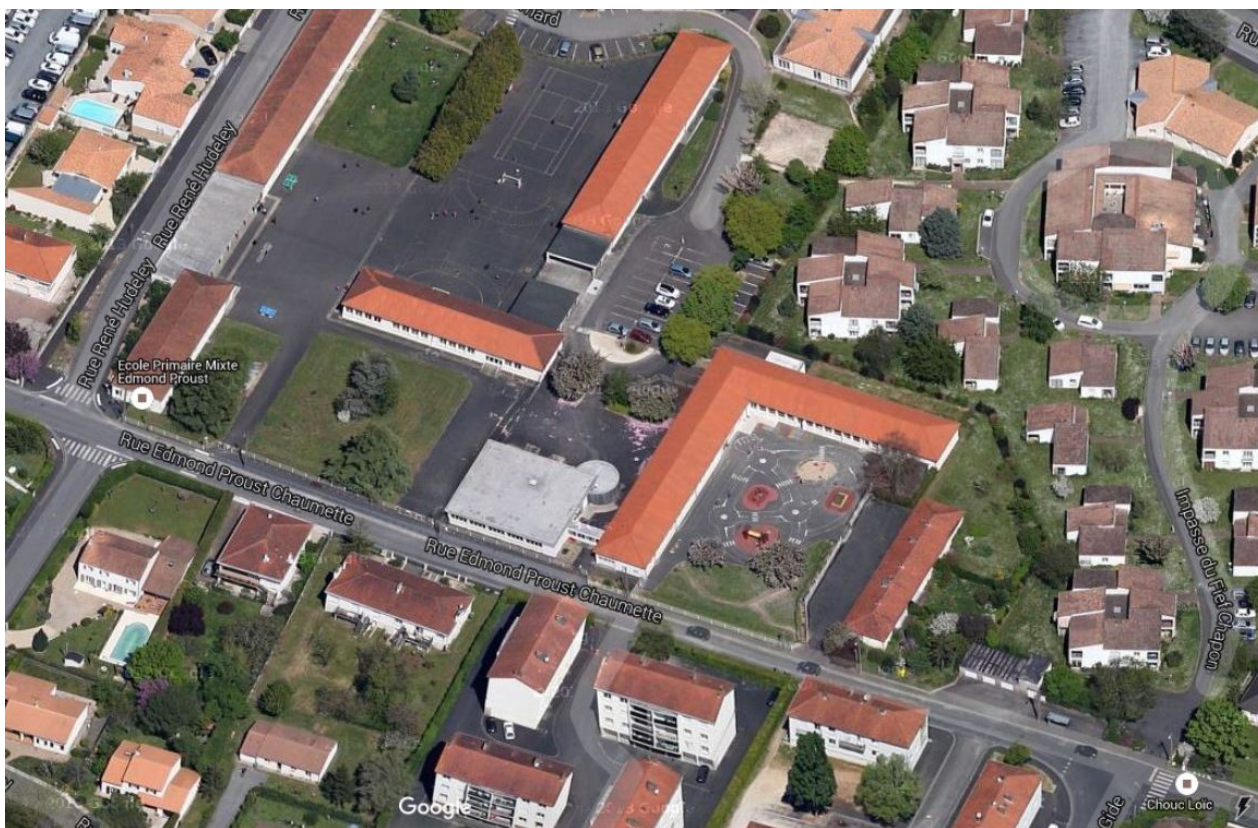
Image satellite du groupe scolaire

Le muret à l'angle de la rue René Hudeley et E. Proust serait reculé pour garder une homogénéité dans le trottoir et faciliter la circulation des piétons. Les passages piétons seraient décalés par rapport aux portillons pour éviter les sorties trop brusques des enfants sur la rue. Les trottoirs seraient repris à ces endroits.