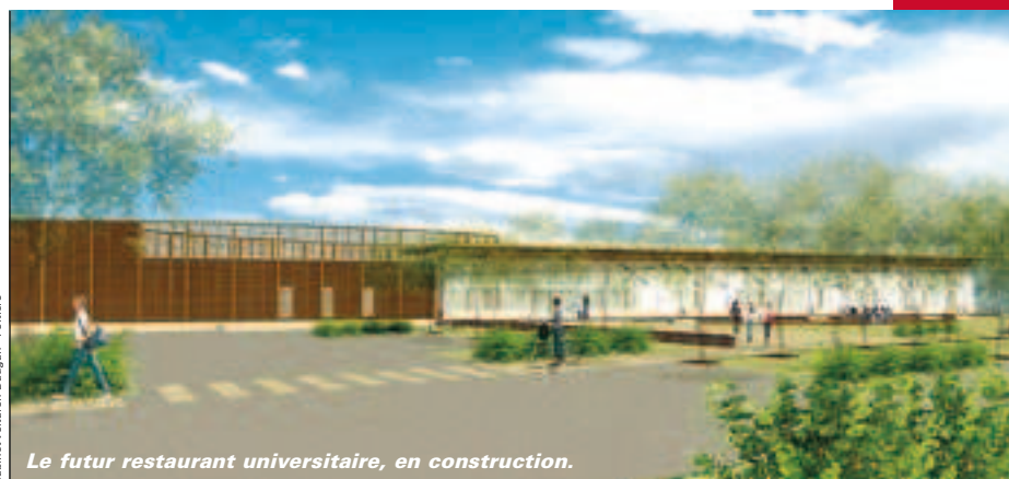
Le futur restaurant universitaire, en construction.