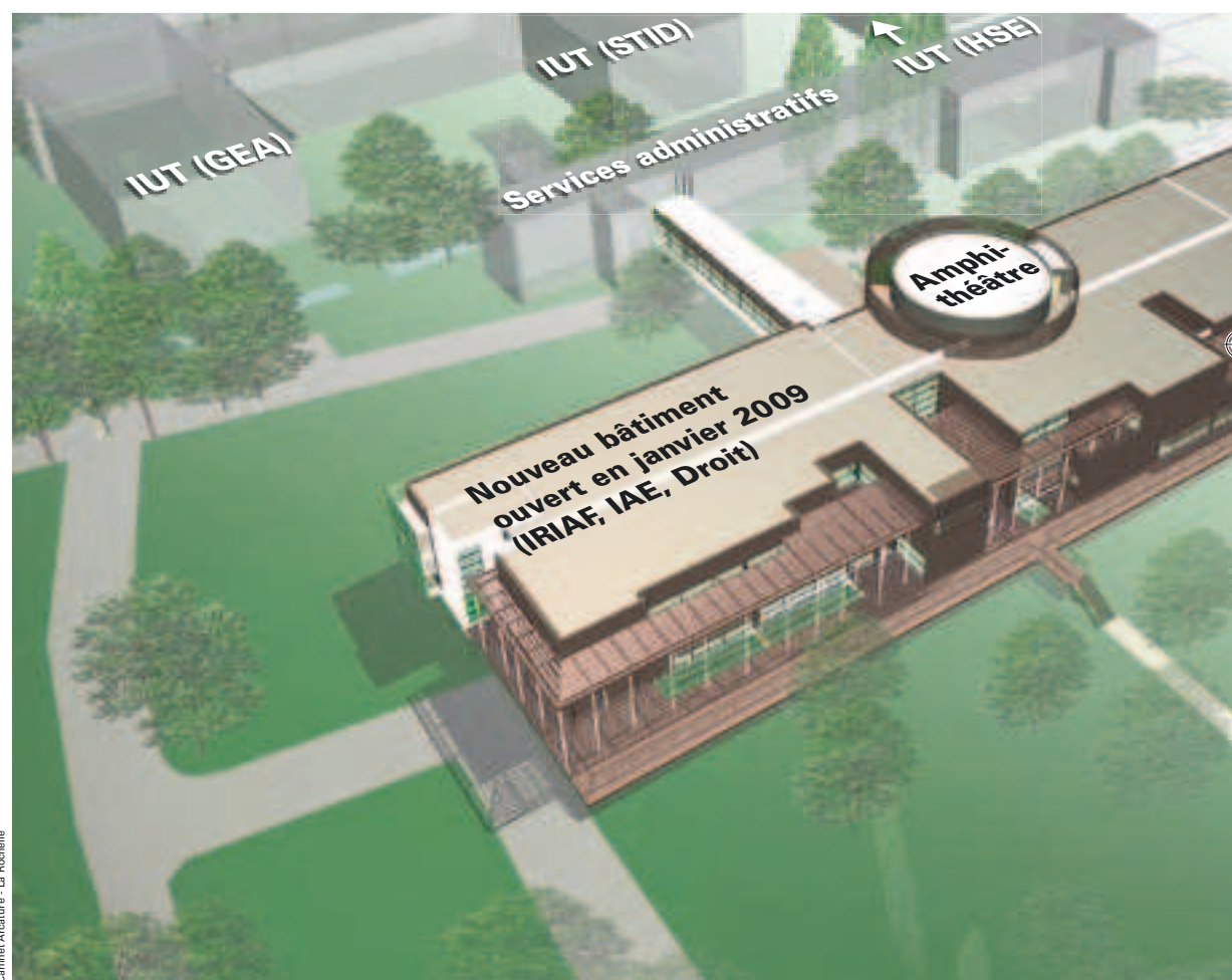
Camille Arcature - La Rochelle

bac, aussi bien des scientifiques que des futurs cadres d'entreprise ou encore des pompiers professionnels. La petite dernière, une licence statistique de la protection sociale, créée cette année, permet d'accueillir des cadres de toutes les organismes sociaux, CAF ou Sécurité sociale. ■