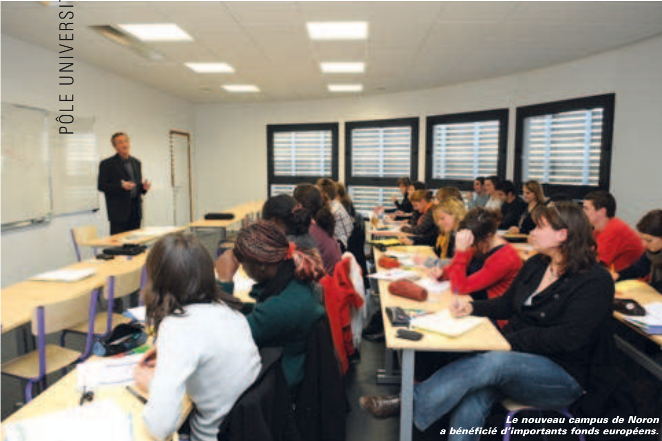
Le nouveau campus de Noron a bénéficié d'importants fonds européens.