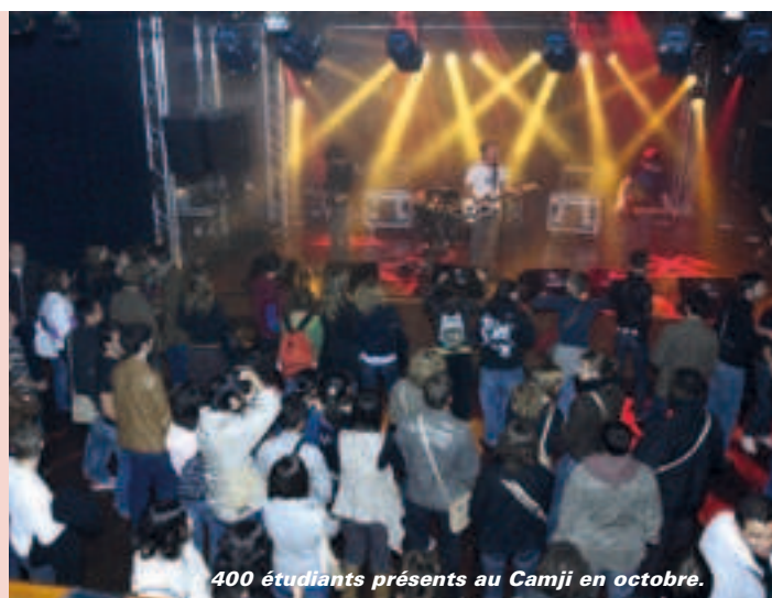
400 étudiants présents au Camji en octobre.

La Ville et la Communauté d'agglomération ont décidé de tout mettre en œuvre pour accueillir au mieux les étudiants à Niort. Déjà très impliquées dans la création puis le financement de notre pôle universitaire, les deux collectivités se sont unies pour mettre en place une grande soirée de bienvenue début octobre. Un vrai succès pour cette première fête "Nec plus ultra" (NEC pour Niort étudiants club !) qui avait réuni environ 400 étudiants, fraîchement arrivés dans notre ville. Des concerts spécialement organisés au Camji étaient précédés d'un mini-forum associatif à l'Hôtel de Ville puis d'une réception officielle. ■