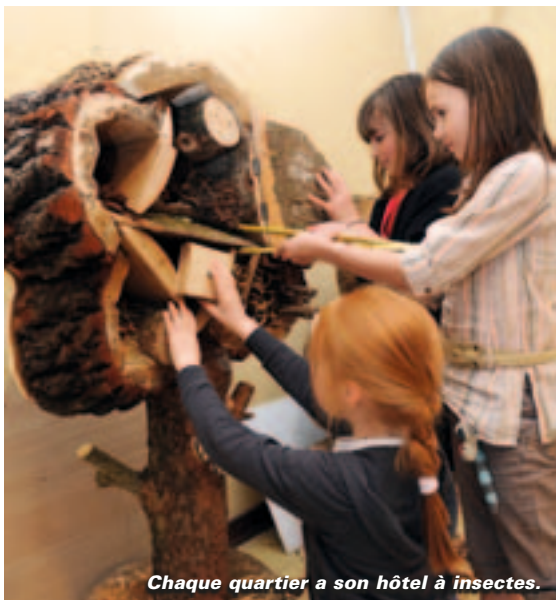
Chaque quartier a son hôtel à insectes.