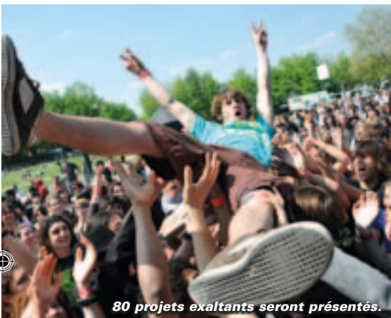
80 projets exaltants seront présentés.

Le 12 mai, de midi à minuit à Noron. Gratuit. Infos sur https://jeunes.poitou-charentes.fr/