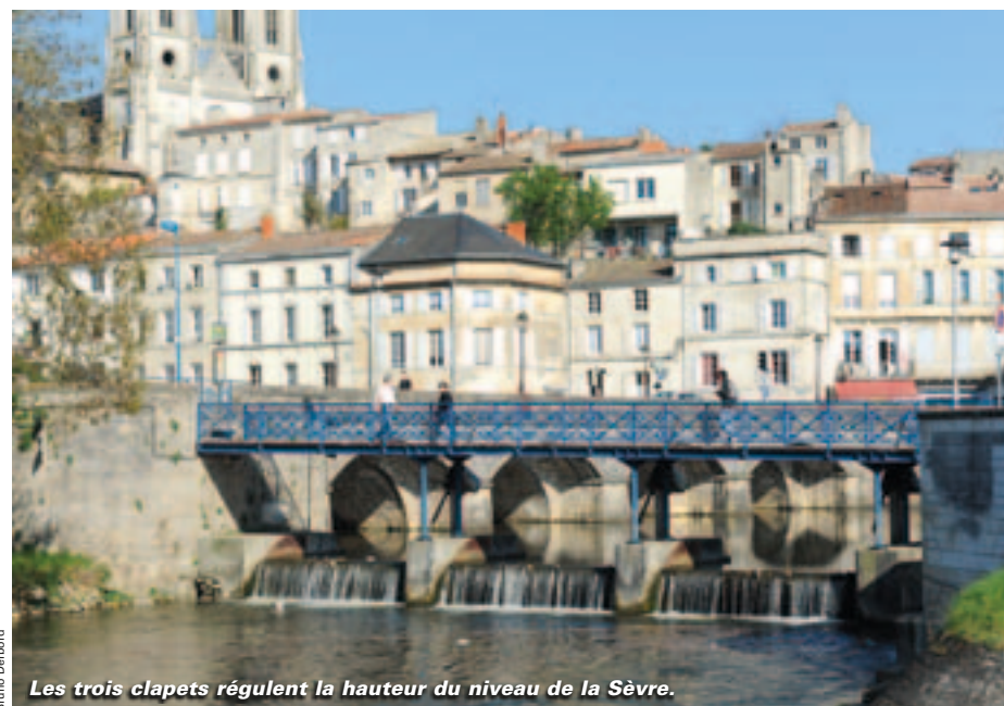
Les trois clapets régulent la hauteur du niveau de la Sèvre.

Afin de minimiser l'impact des travaux sur la vie des Niortais, un site flottant sera aménagé. Les matériels seront mis à l'eau à l'angle du parking du Moulin du milieu, près de la passerelle piétonne sous laquelle sont fixés les clapets. Laquelle passerelle sera d'ailleurs entièrement démontée ; on profitera du chantier pour la restaurer. Le parking sera encombré sur une quinzaine de places, mais les travaux n'auront lieu que du lundi au mercredi, et parfois le vendredi, pour ne pas gêner l'activité du