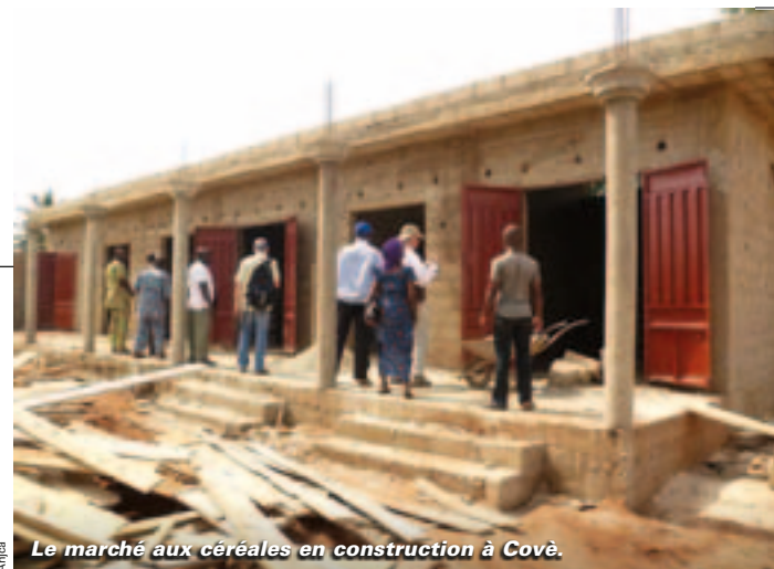
Le marché aux céréales en construction à Covè.

Une délégation de l'association niortaise de jumelage, l'Anjca, s'est rendue au Togo et au Bénin. Chaleur humaine et chaleur tout court au rendez-vous.