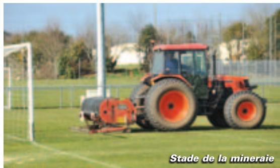
Stade de la mineraie