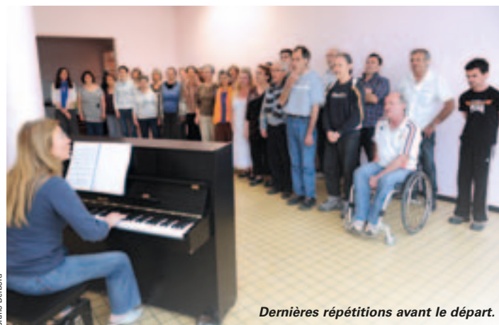
Dernières répétitions avant le départ.

C' est valorisant d'être dans une chorale pareille. "Malades, soignants, il n'y a pas de barrière. On est là pour chanter." "Nous portons ce projet ensemble et nous sommes portés par le projet." Leurs paroles et leur bonheur visible le disent : Ils sont prêts ! Après une tournée en Gâtine et un concert à la chapelle le 2 mai, vingt-deux chanteurs et accompagnateurs de la cho-