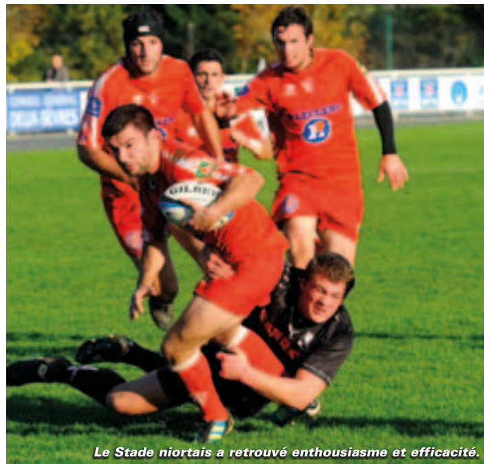
Le Stade niortais a retrouvé enthousiasme et efficacité.