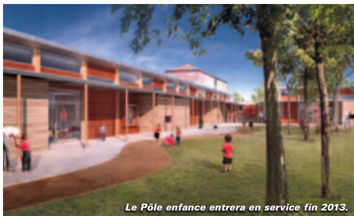
Le Pôle enfance entrera en service fin 2013.

La construction du Pôle enfance démarrera dans la deuxième quinzaine de mai, près de l'ancienne friche de l'usine Erna-Boinot.