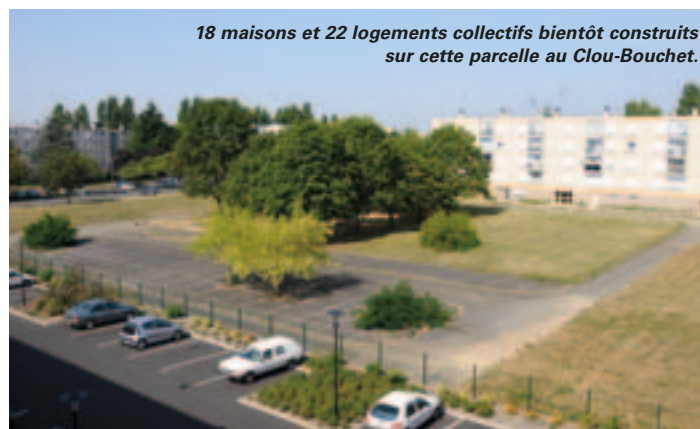
18 maisons et 22 logements collectifs bientôt construits sur cette parcelle au Clou-Bouchet.

Dans les quartiers du Clou-Bouchet et de la Tour-Chabot-Gavacherie, 58 logements nouveaux (29 maisons individuelles et 29 logements collectifs intermédiaires (1) ) seront prochainement construits et proposés à la vente à des tarifs très attractifs. "La clientèle visée est d'abord celle des ménages primo-accédants aux revenus modestes, les familles monoparentales et les jeunes couples, car on est dans un dispositif d'accession sociale à la propriété", précise Josiane Metayer, l'adjointe au logement. Collectifs comme individuels, les 58 logements