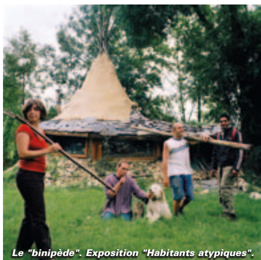
Le "binipède". Exposition "Habitants atypiques".