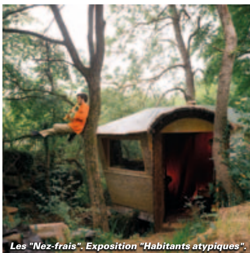
Les "Nez-frais". Exposition "Habitants atypiques".

La 3 e édition du mois de l'architecture propose des regards sur l'habitat, conventionnel ou différent. Expositions, conférences, rencontres, l'architecture investit la ville du 2 au 26 mai.