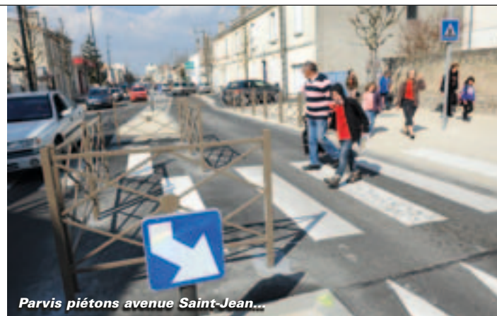
Parvis piétons avenue Saint-Jean...

À Surimeau, le chantier, retardé en raison du froid cet hiver, a démarré en avril et se termine à la fin du mois. Des chicane sont installées rue de la Mineraie et des ralentisseurs au rond-point qui relie les rues D'Antes et de la Mineraie. Le tout pour 85 000 euros financés par le conseil de quartier Nord. À Sainte-Pezenne, le conseil de quartier prend en charge la sécurisation de la rue de la Routière, qui mène au crématorium, pour 68 000 euros. Ainsi que l'embellissement de la cour des