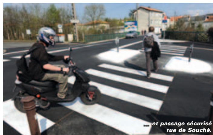
... et passage sécurisé rue de Souché.