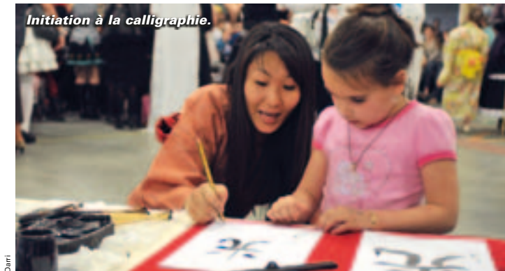
Initiation à la calligraphie.

3 e Japaniort, samedi 12 mai, rue Victor-Hugo, de 10h à 19h. Animations gratuites et ouvertes à tous. Rens. : www.japaniort.com Courriel : contact@japaniort.com