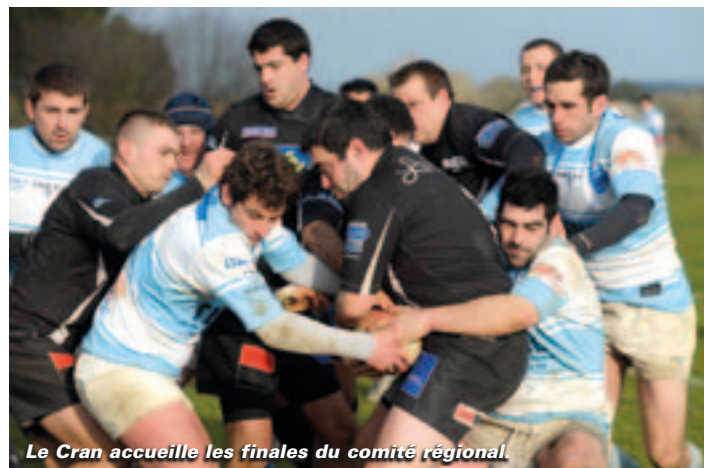
Le Cran accueille les finales du comité régional.

À l'issue de la phase championnat de Fédérale 2, les 4 premiers de chacune des 8 poules s'affrontent en phases finales (ou play-offs). Les 16 e et les 8 e de finales se jouent en aller-retour (le mieux classé reçoit en second). Les ¼ se disputent en un match, sur terrain neutre (les équipes qui les atteignent montent en Fédérale 1).