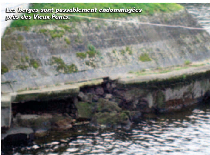
Les berges sont passablement endommagées près des Vieux-Ponts.