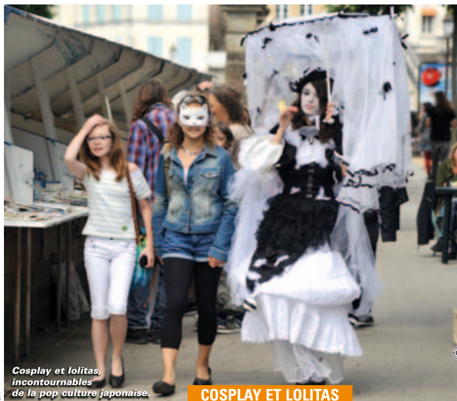
Cosplay et lolitas, incontournables de la pop culture japonaise.