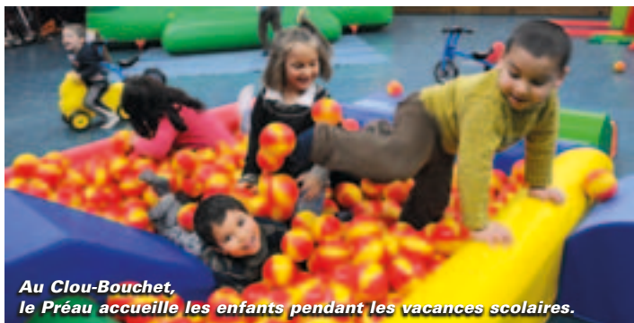
Au Clou-Bouchet, le Préau accueille les enfants pendant les vacances scolaires.