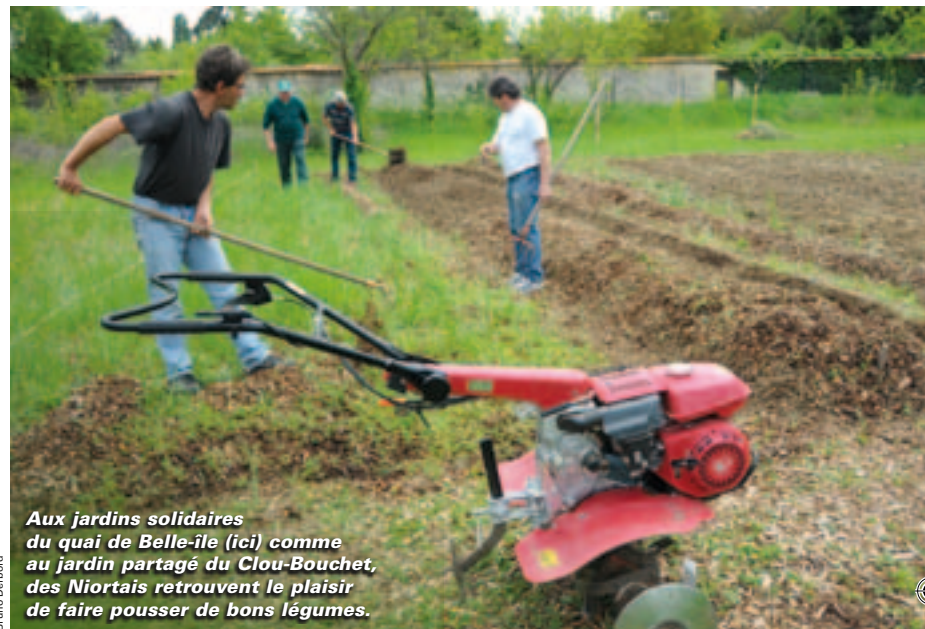
Aux jardins solidaires du quai de Belle-île (ici) comme au jardin partagé du Clou-Bouchet, des Niortais retrouvent le plaisir de faire pousser de bons légumes.

et la Tour-Chabot-Gavacherie, qui sont également les territoires du Projet de rénovation urbaine et sociale (PRUS, lire encadré). "6 000 habitants y vivent. Or un tiers dépendent des minima sociaux." C'est pour réduire les inégalités et parce que la population doit faire face, là plus qu'ailleurs, à des problèmes d'insertion et d'emploi, mais aussi de santé et de vie familiale, que des moyens spécifiques sont alloués à cette politique. À titre indicatif pour 2011, le montant global des actions comprenant les participations de tous les signataires du CUCS s'élève à 740 000 €. "L'État pilote ces contrats avec l'Agglomération, poursuit la responsable. Ils entraînent avec eux de nombreux partenaires." Neuf institutions, dont la Ville, ont signé ce contrat (lire ci-dessous). Chacune intervient sur ses compétences : le conseil géné-