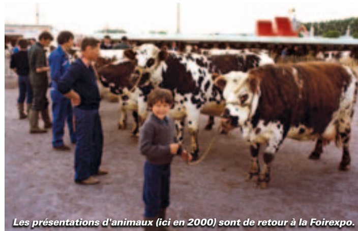
Les présentations d'animaux (ici en 2000) sont de retour à la Foireexpo.

L e casting est de qualité. Parthenaises, Limousines, Blondes d'Aquitaine, Normandes et Prim Holstein font leur grand retour à Noron, onze ans après leur disparition du programme de la Foireexpo. Du 28 avril au 1 er mai, on pourra découvrir les races à viande et à lait, assister à la