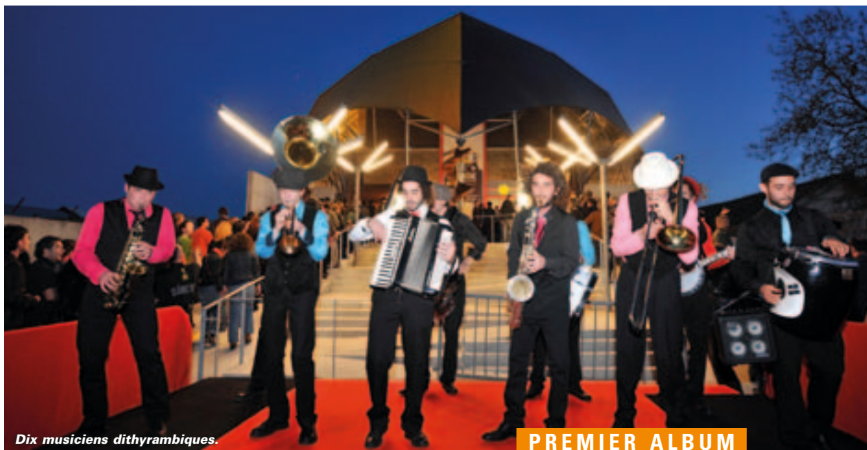
Dix musiciens dithyrambiques.