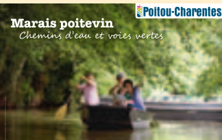
Marais poitevin Chemins d'eau et voies vertes

C eux d'entre vous qui vont régulièrement à Paris ont dû s'en apercevoir : les couloirs du métro sont couverts depuis début avril d'une grande campagne de pub vantant les charmes de notre Marais poitevin, lancée par le Comité régional de tourisme. Une jolie façon d'oxygéner la capitale et de faire découvrir aux Parisiens et à des millions de touristes les atours maraîchins. Pour leur donner des envies de