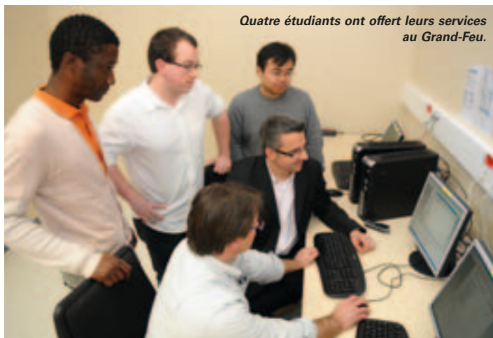
Quatre étudiants ont offert leurs services au Grand-Feu.