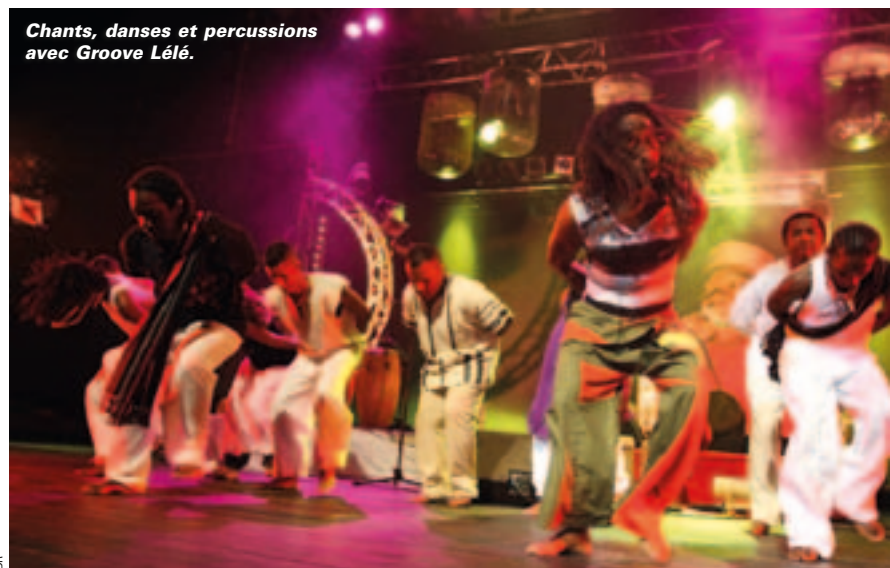
Chants, danses et percussions avec Groove Lélé.

du quartier, rencontreront des Niortais de tous les âges au cours des ateliers et soirées prévus cette semaine. Ils se rendront à la maternelle et à la maison de retraite, en passant par le collège et le lycée. L'association des Réunionnais de Niort mettra la main à la pâte. Plusieurs temps de partage sont ouverts à tous ( lire ci-dessous ), au cours des soirées et de la journée du mercredi, qui verra