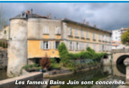
Les fameux Bains Juifs sont concernés.

deux critères principaux : la forte dégradation des biens et leur vacance. Beaucoup d'immeubles ont des niveaux au-dessus des commerces vacants et priorité a été donnée à ceux ayant la possibilité d'aménager un accès indépendant aux étages. Les propriétaires concernés ont reçu fin mars un courrier les informant de cette obligation de travaux. S'ils réhabilitent pour louer, ces propriétaires pourront prétendre aux aides de l'Opah-RU.