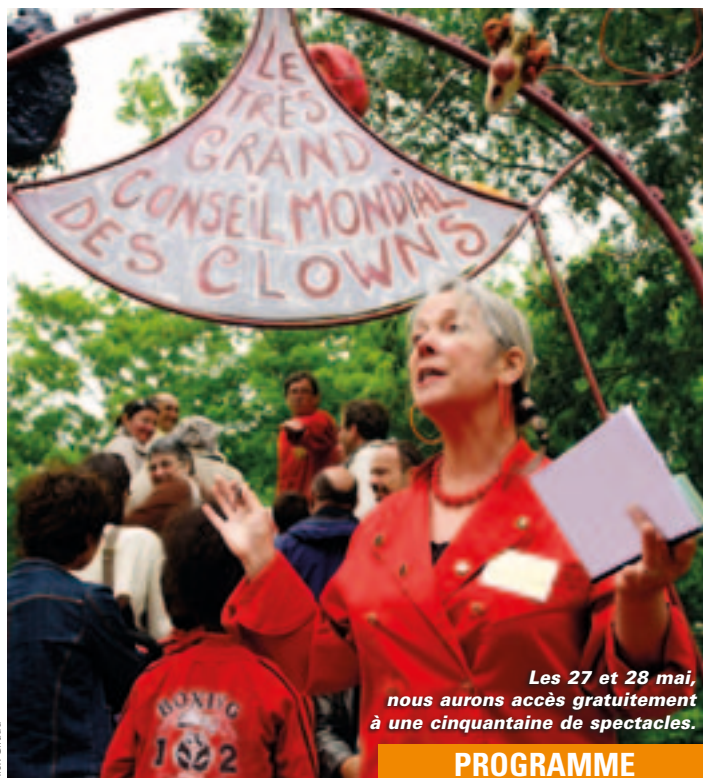
Les 27 et 28 mai, nous aurons accès gratuitement à une cinquantaine de spectacles.

Mais mis à part ce moment un peu institutionnel, tout le reste sera totalement ouvert au public et gratuit. Ça commencera sur la place des Halles à 19h le vendredi 27 mai. Après les arrivées rocambolesques des sessions précédentes en train, en bateau, en voitures bizarres et en parachute, allez savoir ce qu'ils nous réservent cette fois-ci ! Les lancements du TGCMC sont toujours spectaculaires. Ensuite, les soixante clowns et leur public fileront en procession vers la colline Saint-André, haut lieu des festivités cette année. Le lendemain, après quelques parades urbaines pour effacer les brumes de la veille, la colline s'éveillera vers 14h30 avec l'animation "Mômes en fêtes". "Les clowns envahiront tous les