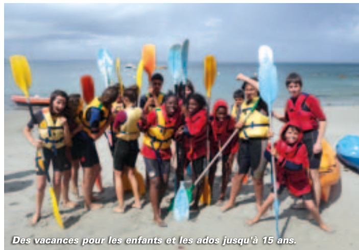
Des vacances pour les enfants et les ados jusqu'à 15 ans.

T op départ pour l'été : du 11 au 13 mai, de 8h à 17h, des agents des centres de loisirs municipaux nous accueilleront à l'Hôtel de Ville pour inscrire nos enfants. Tout d'abord, les séjours et stages pour les jeunes de 8 à 15 ans : la matinée du mercredi 11 mai leur sera réservée. Vacances au Pays basque ou stage culinaire complet avec les chefs de la restauration scolaire en juillet, séjours en Deux-Sèvres en août... Le menu est varié mais attention, le nombre de places est limité ! Bon à savoir : pour les familles avec quotient familial de 1 à 5, des tarifs très réduits seront pratiqués grâce à une aide de la CAF versée directement à l'organisateur. Cette aide vient en déduc-