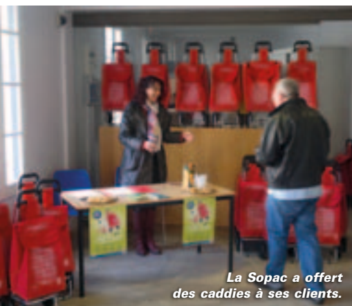
La Sopac a offert des caddies à ses clients.

L e saviez-vous ? La Sopac, la société d'économie mixte qui gère le stationnement payant à Niort, vient de fêter ses 25 ans. Sympathique anniversaire que la société a voulu marquer en offrant à tous ses clients et abonnés un super caddie de cou-