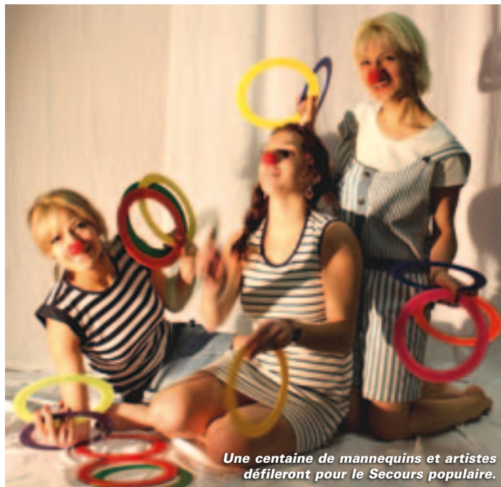
Une centaine de mannequins et artistes défilent pour le Secours populaire.