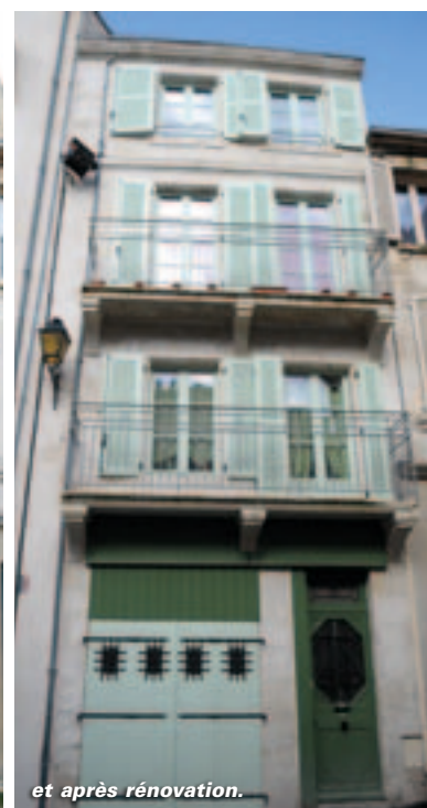
et après rénovation.

conseil municipal du 28 mars dernier. D'ici le terme du programme, les partenaires soutiennent la réhabilitation de logements locatifs avec des taux de subventions cumulés allant de 50% à 90% suivant l'état initial du logement et le loyer qui sera pratiqué. Les propriétaires occupants bénéficient d'aides qui peuvent atteindre 35% à 80% du montant des travaux et, sous condition, d'une prime d'aide à la rénovation thermique. L'enveloppe globale pour cette dernière phase s'élève à un peu moins de 1,4 millions d'euros pour l'Anah et