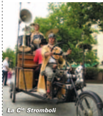
La Cie Stromboli