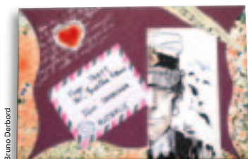
Une découverte : l'art postal.

L'exposition des travaux réalisés sera visible à la Mission locale, 3 rue de l'Ancien Musée du 3 au 31 mai.