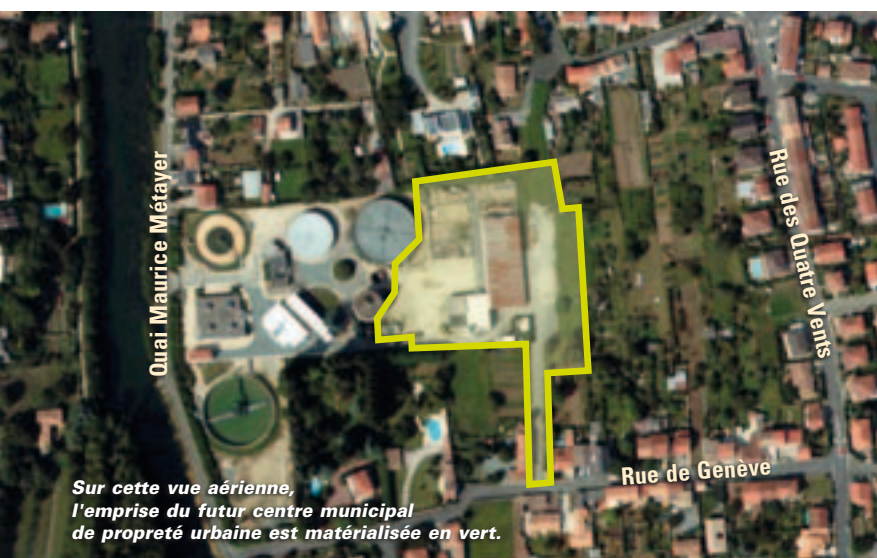
Sur cette vue aérienne, l'emprise du futur centre municipal de propreté urbaine est matérialisée en vert.

Entre le quai Métayer et la rue de Genève, l'ancienne station d'épuration niortaise va être réhabilitée. La Ville a fait le choix d'une architecture écologique pour accueillir le service municipal de propreté.