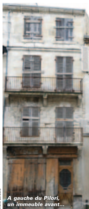
A gauche du Piloni, un immeuble avant...

Lutte contre l'habitat indigne, rénovation thermique, incitation à des loyers conventionnés... Les partenaires ont fixé de nouveaux objectifs pour la période 2011-2012. En effet, la réforme des aides de l'Anah, entrée en vigueur au 1 er janvier, recentre son intervention sur les logements les plus dégradés ainsi que sur les propriétaires occupants. Ceux-ci peuvent prétendre à des aides pour l'isolation et la rénovation thermique de leur logement. La Ville veut continuer à favoriser la mixité sociale et la mise en location de logements vacants. Un avenant à la convention Opah-RU a donc été validé au