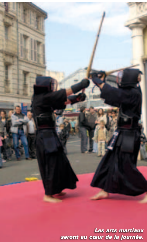
Les arts martiaux seront au cœur de la journée.

Le 14 mai en centre-ville et aux anciennes usines Boinot. Rens. et prog. contact@japaniort.com ; www.japaniort.com . Ouverture spéciale des boîtes à bouquins, quai de la Préfecture ; des mangas seront à vendre.