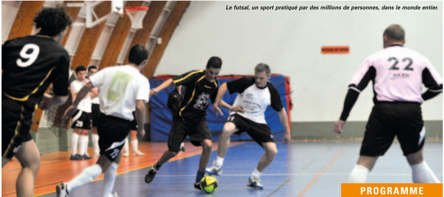
Le futsal, un sport pratiqué par des millions de personnes, dans le monde entier.

Les Niortais commencent à s'intéresser sérieusement au futsal. Le tournoi national du mois de février peut contribuer à faire de notre ville une place forte de ce sport dans la région.