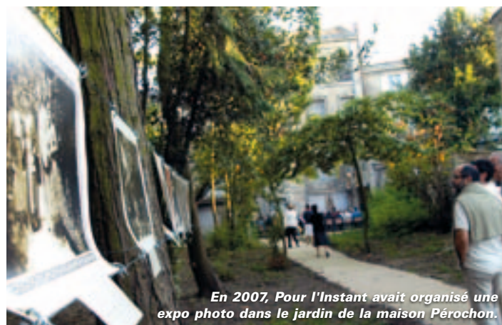
En 2007, Pour l'Instant avait organisé une expo photo dans le jardin de la maison Pérochon.