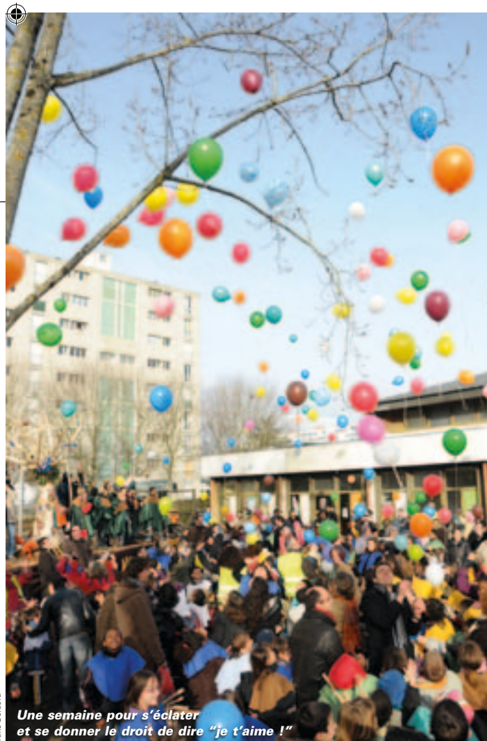
Une semaine pour s'éclater et se donner le droit de dire "je t'aime !"

Semaine de l'amour, du 12 au 19 fév. Rens. : Maison de quartier du Clou-Bouchet, boulevard de l'Atlantique : 05 49 79 03 05 et Maison de quartier du quartier Nord, 1 place de Strasbourg : 05 49 28 14 92. Gratuit.