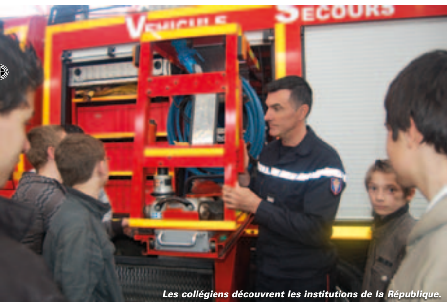
Les collégiens découvrent les institutions de la République.