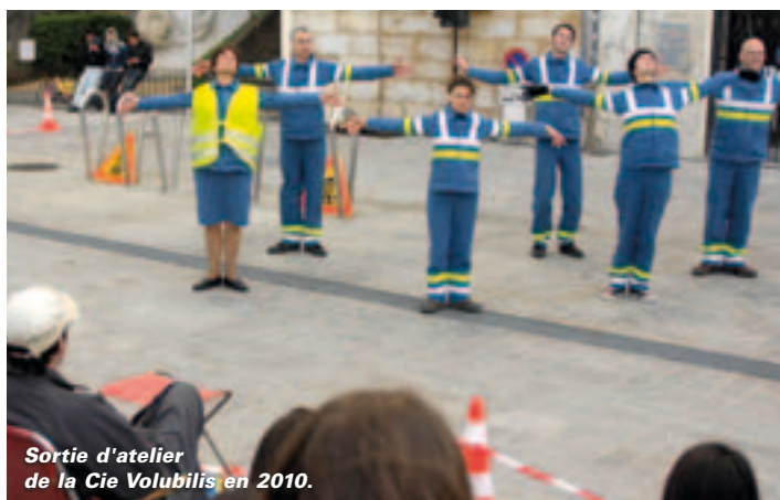
Sortie d'atelier de la Cie Volubilis en 2010.