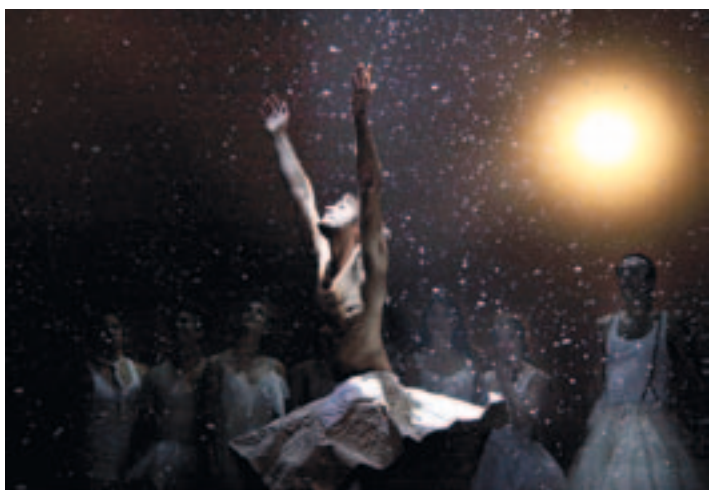
Les Productions Nebbia/Viviana Cingolosi