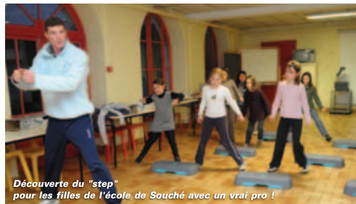
Découverte du "step" pour les filles de l'école de Souché avec un vrai pro !

a "demandé à ses parents." Car il faut l'autorisation des parents, bien sûr, même si ces activités n'entraînent pas de surcoût pour les familles et sont facturées comme la garderie "classique". "Les tarifs sont calculés selon le quotient familial c'est-à-dire qu'ils vont de la gratuité à 0,90 euro la