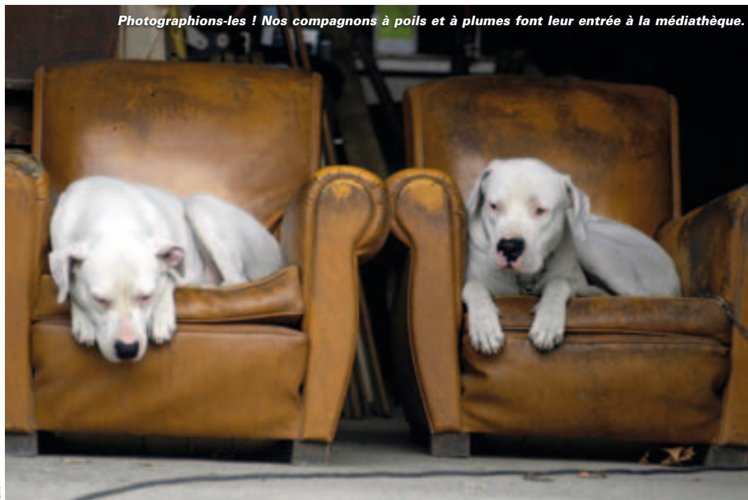
Photographions-les ! Nos compagnons à poils et à plumes font leur entrée à la médiathèque.

Dès maintenant, nous pouvons participer au grand collectage de photos d'animaux domestiques, à partir duquel sera composé un grand mur d'images à compter de ce mois-ci et jusqu'à fin avril. Chat, chien, boa, hamster ou perruche ? Au jardin, en cage ou au panier ? Soumis à des règles strictes ou détenteur de privilèges ? Photographions-les !