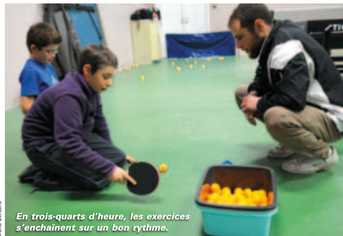
En trois-quarts d'heure, les exercices s'enchaînent sur un bon rythme.

Structure performante en compétition, le SA Souché n'en oublie pas moins sa mission d'intégration des handicapés. Il collabore avec l'Institut médico-éducatif (IME), avec le Groupe d'entraide mutuelle (GME) pour les adultes déficients mentaux, avec le Geist pour les personnes atteintes de trisomie 21. Depuis fin 2010, un créneau est réservé aux patients adultes de l'hôpital, souffrant de troubles psychiatriques.