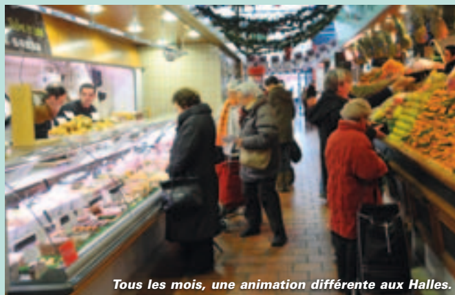
Tous les mois, une animation différente aux Halles.