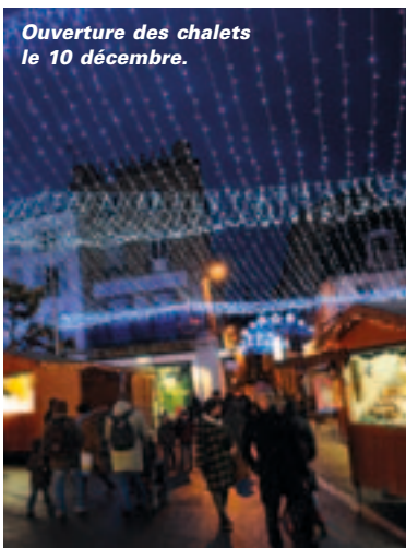
Ouverture des chalets le 10 décembre.

Mais cette année, quelques nouveautés d'ailleurs devraient titiller nos papilles et nos narines : un chalet embaumera la tartiflette et un autre nous fera découvrir des délices alsaciens, la grande région des marchés de Noël. Sans oublier les crêpes et le vin chaud ou encore les marrons et cacahuètes grillées... ■