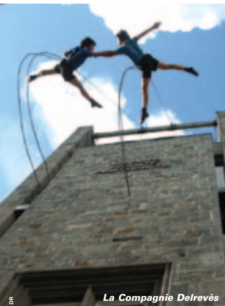
La Compagnie Delrevès

Le 10 décembre, à partir de 18h45, place du Port, le duo de danseurs espagnols Delrevès nous fera lever les yeux vers l'immeuble de la CPAM. Appelée elle aussi à être transformée, notre bonne vieille Sécu. va devenir la scène improbable d'une chorégraphie... verticale. Grand frisson et émotions. Les deux artistes catalans aux multiples talents ont été formés aux arts martiaux, au théâtre et à la danse contemporaine avant de s'élancer à corps perdus – au sens littéral du terme – vers une discipline inimaginable : la danse verticale. Un défi à l'apesanteur qui joue avec l'architecture et emprunte des techniques à l'escalade tout autant qu'à la danse véritable. Accompagnés de deux musiciens, l'un au violoncelle, l'autre aux samples, les