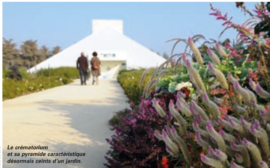
Le crématorium et sa pyramide caractéristique désormais ceints d'un jardin.