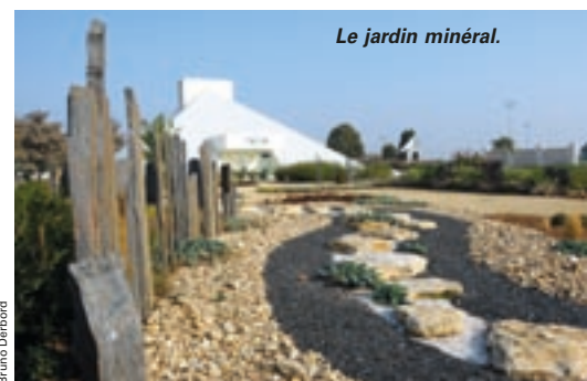
Le jardin minéral.