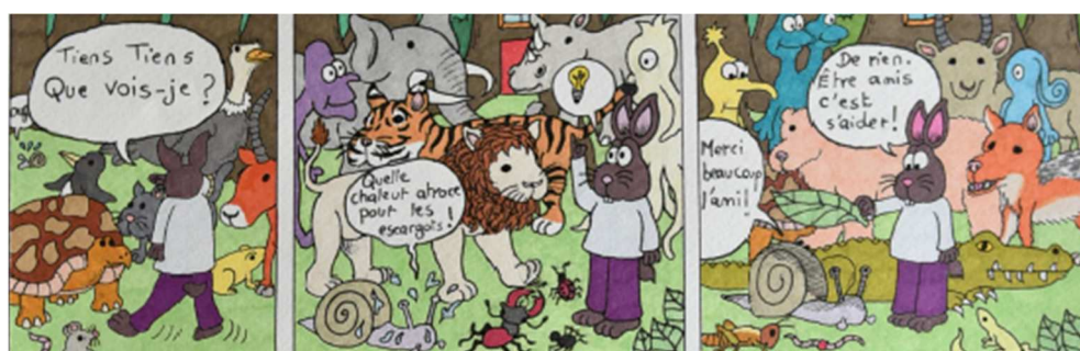
Extraits de planches BD « Citoyenneté et handicap » © Direction de l'Education