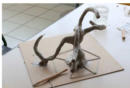
Atelier art-thérapie - sculptures de rocaille