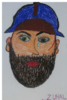
Atelier d'art-thérapie Lycée Gaston Barré © Zuhal