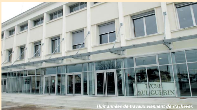
Huit années de travaux viennent de s'achever.