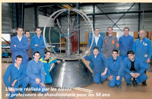
L'œuvre réalisée par les élèves et professeurs de chaudronnerie pour les 50 ans.