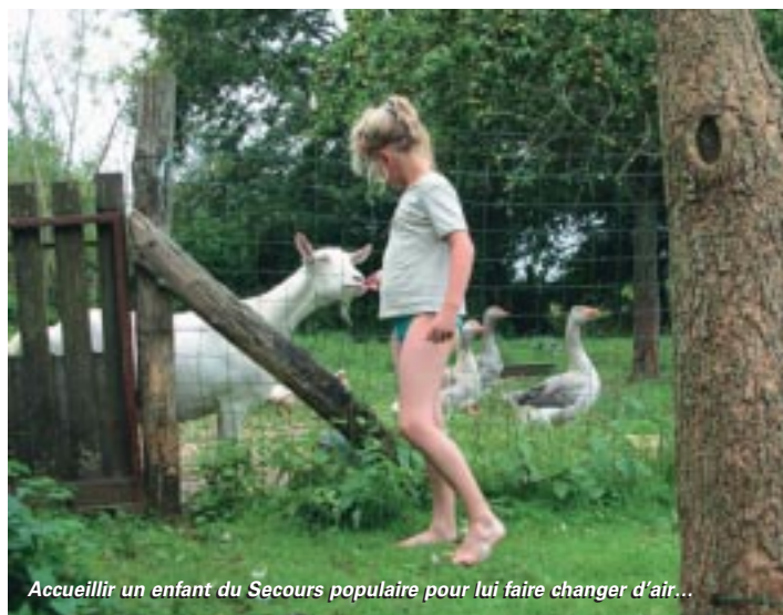
Accueillir un enfant du Secours populaire pour lui faire changer d'air...