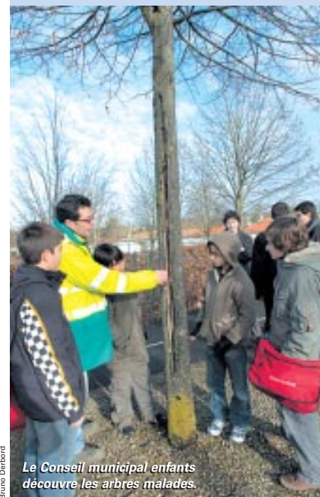
Le Conseil municipal enfants découvre les arbres malades.

Les arbres en ville ont la vie dure, nous le savons. Entre la pollution, les maladies, les chocs des voitures qui se garent un peu trop brusquement, certains arbres ne font pas de vieilles branches... C'est le cas de 64 tilleuls boulevard Allende qui ont dû être abattus pour cause de maladie. Seuls trois d'entre eux sont suffisamment en état pour pouvoir être replantés ailleurs et ne pas finir leur vie solitaires. Mais rassurez-vous, la Ville a prévu d'ores et déjà de replanter de nouvelles essences sur le boulevard, des essences qui seront choisies avec le Conseil municipal des enfants. Les jeunes conseillers se sont déjà rendus sur place en janvier avec des techniciens municipaux des Espaces verts. Mais soyez patients car les nouveaux arbres ne pourront être plantés qu'à la sainte Catherine "où tout prend racine". ■