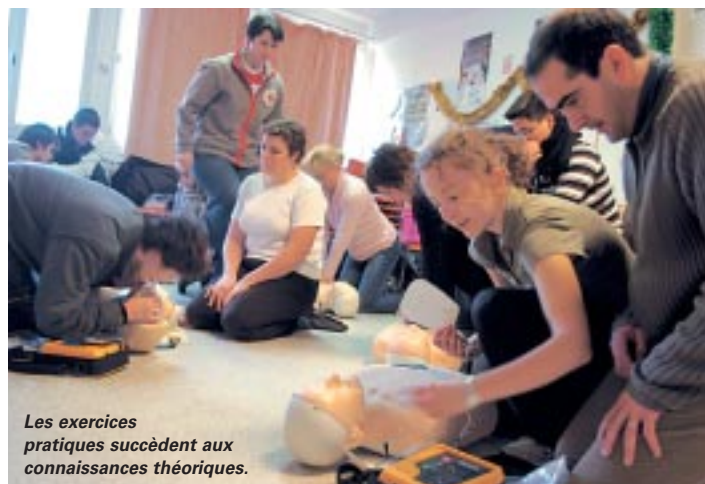
Les exercices pratiques succèdent aux connaissances théoriques.

L'appréhension de toutes les situations ou presque afin que vous puissiez reconnaître une personne inconsciente qui respire ou qui ne respire plus, qui a subi des traumatismes ou un malaise, le cas de la chute du