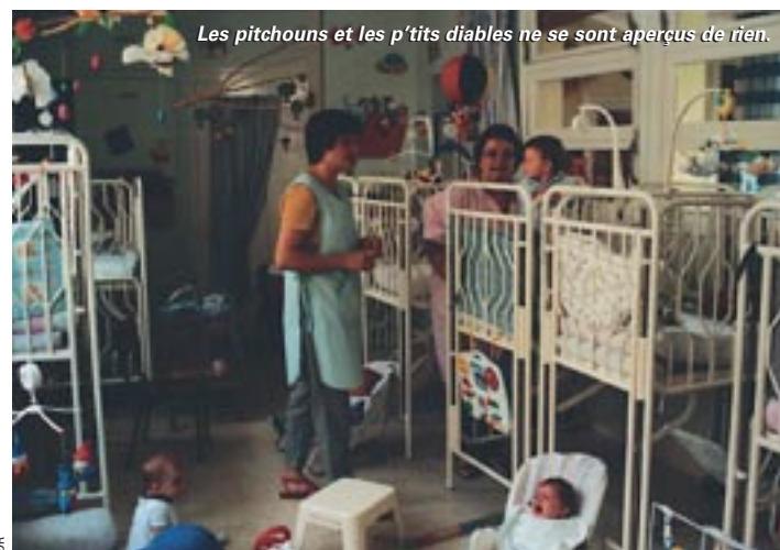
Les pitchouns et les p'tits diables ne se sont aperçus de rien.

La petite crèche associative rue du Mûrier, qui existe depuis plus de 40 ans, est reprise par le Centre communal d'action sociale. Une mesure qui va permettre de sauver l'établissement, ses 45 places... et 20 emplois