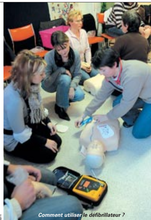
Comment utiliser le défibrillateur ?

ou encore sur des surfaces métalliques" précise la formatrice. A Niort, la Poste est déjà équipée de cet appareil qui à l'avenir devrait se trouver dans tous les lieux publics comme par exemple les gares, aéroports ou même, les grandes surfaces. Puisque ce défibrillateur est amené à être accessible au grand public, les détenteurs de la formation seront les premiers à pouvoir intervenir en cas d'urgence en attendant l'arrivée des