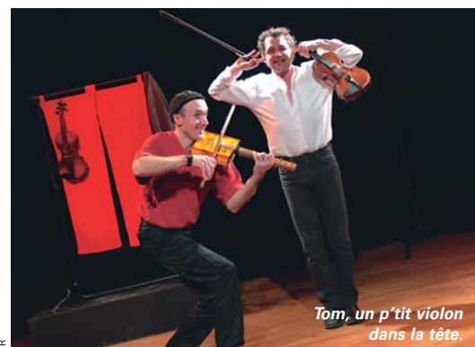
DR Tom, un p'tit violon dans la tête.