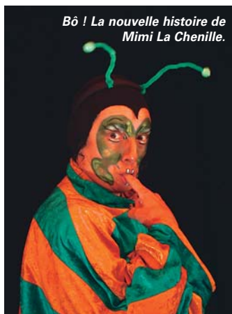
Bô ! La nouvelle histoire de Mimi La Chenille.