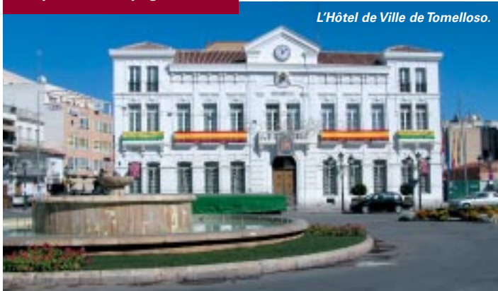
L'Hôtel de Ville de Tomelloso.

période où notre ville jumelle dépassa sa ville d'origine. Mais elle ne gagna son statut véritable de ville qu'en 1927 en passant la barre des 20 000 habitants grâce à l'arrivée d'une nombreuse main-d'œuvre venue travailler dans les vignes. Empreinte de viticulture depuis toujours, Tomelloso est aujourd'hui encore caractérisée par les hautes cheminées des anciennes distilleries qui ont été plus de cent à fonctionner à leur apogée et par ses caves que l'on peut visiter. A découvrir également les fameux "bombos", ces constructions arrondies édifiées par les paysans de la région, dont l'une a été transformée en musée. Et, à côté de la mairie, la magnifique "Posada de los Portales", auberge du XVII e siècle qui abrite désormais des expositions temporaires. ■