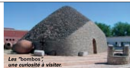
Les "bombos", une curiosité à visiter.

Ce qui fait d'elle le centre agro-industriel de sa région. Mais Tomelloso a la particularité d'avoir réussi à développer de façon équilibrée les trois secteurs d'activités économiques traditionnels : agricole, industriel et tertiaire. Entre les distilleries, qui sont nées à la fin du XIX e siècle et ont fait de la région le plus grand producteur de vin du monde à la moitié du XX e siècle et l'émergence des petites et moyennes industries, notre ville jumelle a réussi à conserver son dynamisme et le niveau de sa population, proche de 35 000 habitants. Pourtant, Tomelloso ne s'est développée qu'au XV e siècle, avec les bergers qui venaient abreuver leurs troupeaux, au carrefour des routes qui conduisent à Tolède au nord, à Valence à l'est et à Cordoue, au sud-ouest. D'abord bourgade dépendant de la ville de Socuellamos, Tomelloso n'a réussi à obtenir son indépendance qu'au XVIII e siècle,