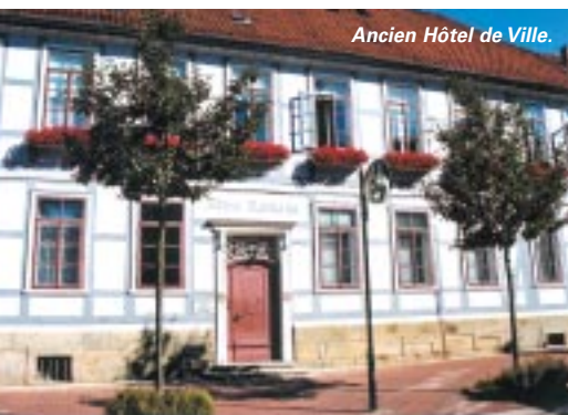
Ancien Hôtel de Ville.

A u nord-ouest de l'Allemagne, dans le land agricole de Basse-Saxe, Springe coule des jours heureux au pied