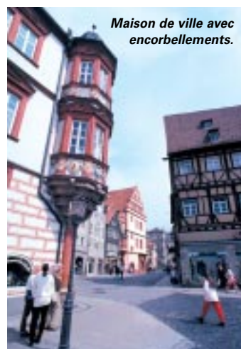
Maison de ville avec encorbellements.

A u cœur verdoyant de l'Allemagne, Coburg se niche entre la haute vallée du Main et la forêt de Thuringe, au nord du Land de la Bavière. La ville, que l'on trouve sur la célèbre route des châteaux ( Burgenstrasse ), reste avant tout un grand centre historique et touristique. Elle était en effet depuis le XIV e siècle la capitale des ducs de Coburg, l'une des plus puissantes familles aristocratiques d'Allemagne. Coburg est réputée pour ses fortifications du Moyen Âge et sa forteresse ( Veste ) où Martin Luther, le fondateur de l'église réformée, trouva refuge en 1530. Mais aussi l'imposant Ehrenburg (palais d'honneur), la résidence des ducs de Saxe-Coburg et Gotha jusqu'à la fin de la Première Guerre mondiale. Entre la place du château et la place du marché, les maisons typiques évoquent différentes époques, du gothique au rococo en passant par le style Renaissance. Sans oublier le " Coburger Erker ", ces encorbellements que l'on retrouve