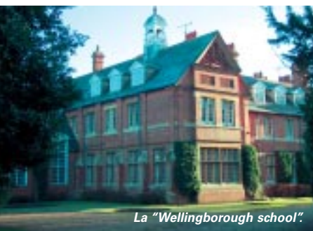
La "Wellingborough school".

Située juste entre les deux rivales prestigieuses de Cambridge et d'Oxford, notre ville jumelle anglaise est aussi toute proche de Londres... 70 miles c'est-à-dire environ 113 kilomètres de la capitale du Royaume-Uni, de même qu'elle n'est qu'à une centaine de kilomètres de Birmingham. Refuge de nombreux Londoniens pendant la dernière guerre, Wellingborough était alors célèbre pour la fabrication de chaussures, sa principale industrie jus-