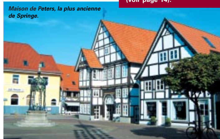
Maison de Peters, la plus ancienne de Springe.

de Peters, construite au début du XVII e siècle. Derrière une plaque commémorative, la "lampe éternelle" reste toujours allumée sur la façade d'une maison de la rue "zum Obentor". C'est là que naquit l'inventeur de l'ampoule électrique, Heinrich Göbel. Aujourd'hui, ce sont les luminaires Paulmann, connus dans le monde entier, qui font honneur à cette découverte réalisée 25 ans avant l'Américain Edison. ■