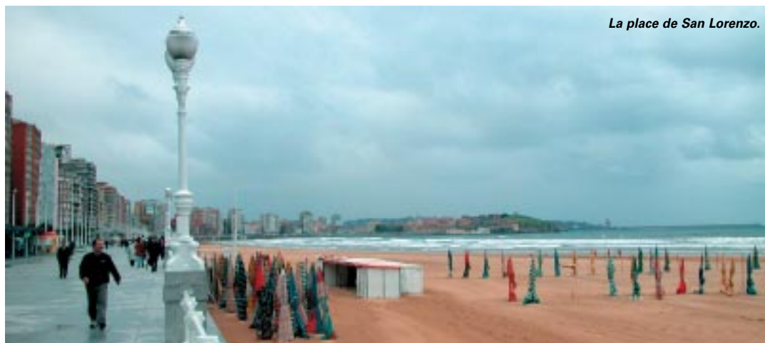
La place de San Lorenzo.

a marqué l'histoire de Gijón depuis des millénaires. Port de la "ruta de la plata" – la "route de l'argent", construite par les Romains, qui la relie à Séville – la ville conserve des traces de son passé. En particulier, l'une des principales fortifications du nord de l'Espagne, antérieure à 490 avant JC ainsi que des thermes datant de la fin du 1 er siècle avant JC. Au Moyen Âge, la ville est toujours occupée comme en témoignent ses églises romanes mais à la fin du XIV e siècle, Gijón est détruite dans sa presque totalité pendant la guerre qui oppose les deux camps prétendants à la couronne, les