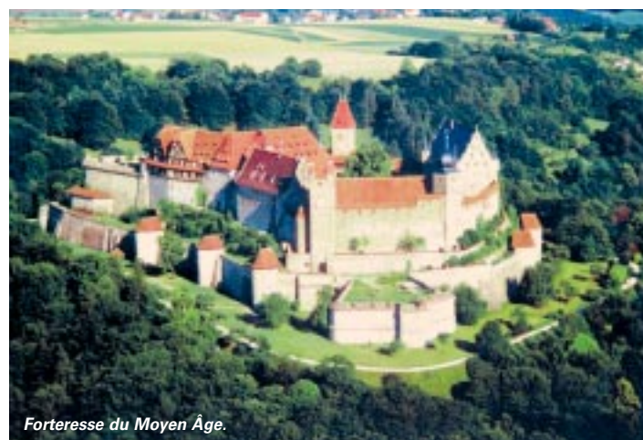
Forteresse du Moyen Âge.

des deux Allemagne, notamment grâce à ses infrastructures culturelles (son théâtre national emploie 230 personnes). A côté des activités agricoles, c'est en outre un important centre de fabrication de poupées et de jouets. A l'instar de sa jumelle niortaise, Coburg a elle aussi sa société d'assurance, la compagnie Huk, qui est l'un des premiers employeurs de la ville. Norbert Kastner en est le maire depuis 17 ans. A 31 ans, il était l'un des plus jeunes élus du pays. En 2005, Coburg a été consacrée comme ville exemplaire par le Conseil de l'Europe. ■