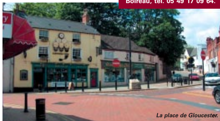
La place de Gloucester.

Angleterre de légende en rejoignant l'un des nombreux pubs de la ville ou en allant découvrir la magnifique Wellingborough school, fondée en 1595... Mais nous pouvons aussi nous intéresser à la richesse multiculturelle de la ville du XXI e siècle, qui, forte des communautés qui s'y côtoient, abrite aujourd'hui un centre hindou et une mosquée musulmane... ■