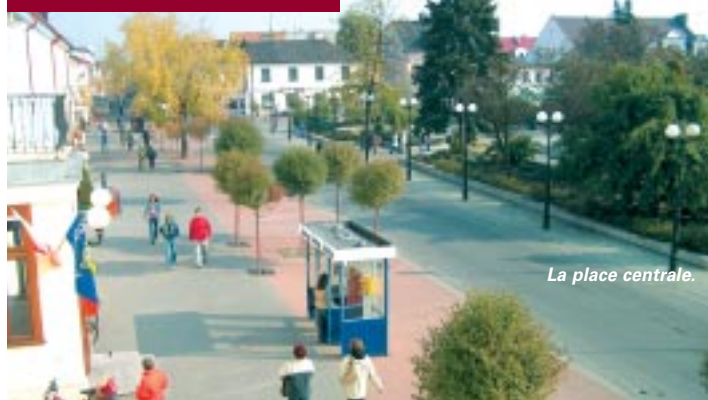
La place centrale.

russe du XVII e au XX e siècle est l'une des plus importantes en Pologne. Dans un bâtiment annexe, anciennement occupé par la Gestapo, une exposition permanente est consacrée à la lutte du peuple de Podlasie contre ses deux occupants, hitlérien et soviétique. ■