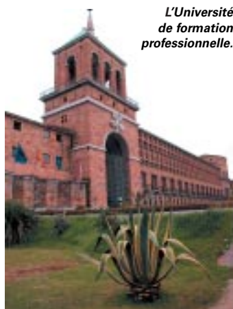
L'Université de formation professionnelle.

Située sur la côte nord-ouest de l'Espagne, la ville de Gijón (prononcer "rironne") est comme un grand sémaphore qui éclaire la côte des Asturies, la "costa verde" entre Saint-Sébastien à l'est et La Corogne à l'ouest. Grande ville portuaire de près de 300 000 habitants, l'une de nos deux villes jumelles espagnoles est intimement liée à l'Atlantique, avec un climat tempéré et une pluviosité proche de la nôtre. L'impétueuse mer Cantabrique