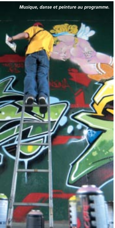
Musique, danse et peinture au programme.