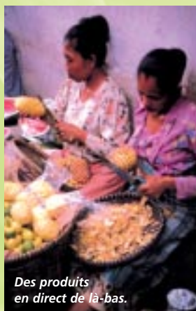
Des produits en direct de là-bas.

Au bout du pavillon, un restaurant typique d'une centaine de places assises propose un véritable voyage gustatif. Le chef, spécialement venu d'Indonésie, a concocté le "nasi-goreng", le "gado-gado", les satés, ces petites brochettes épicées ou caramélisées, et toutes les délicieuses spécialités qui font la très grande richesse gastronomique du pays. De la terrasse, vous aurez vue sur la plage, où une embarcation à balancier