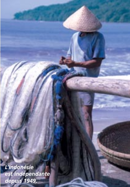
L'Indonésie est indépendante depuis 1949.