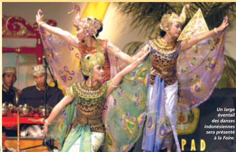
Un large éventail des danses indonésiennes sera présenté à la Foire.

Chacun a en tête l'image d'Épinal des danseuses de Java et de Bali avec leurs costumes, leurs gestes gracieux, leurs mains qui ressemblent à des oiseaux. Ce que l'on sait moins, c'est qu'il en existe toute une gamme. Tari Pajembrama (danse balinaise de bienvenue qui permet aux danseurs de temple d'accueillir les visiteurs sous une pluie de pétales de fleurs) ; Oleg Tambulilingan (le combat des bourdons) ; Tari Belibis (vol des jeunes hérons) ; Wira Pertiwi (qui évoque une femme guerrière armée d'un arc et de flèches) ; Jaipongan (danse qui intègre les mouvements d'arts martiaux sur une musique aux influences arabes) ne sont que quelques exemples de cet art aussi riche que gracieux. ■