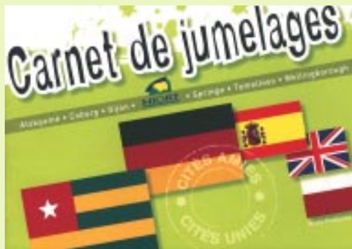
Un guide vient de paraître sur nos villes jumelées.

l'Hôtel administratif. Ce guide présente de façon très agréable les villes jumelées avec la nôtre : Atakpamé au Togo, Cobourg et Springe en Allemagne, Gijón et Tomelloso