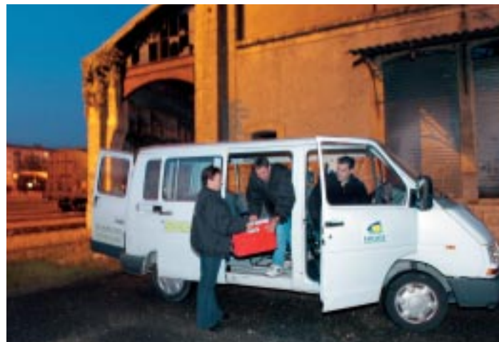
L'équipe du Samu social tourne dans les rues durant tout l'hiver.