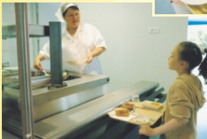
Le self favorise l'apprentissage de l'autonomie et limite les temps d'attente.

Il est midi et le service de restauration du groupe scolaire Ernest-Pérochon vient de débiter pour les quelque 110 élèves du quartier de la Tour-Chabot. En retrouvant leur restaurant scolaire après plusieurs mois de travaux, les enfants ont troqué les longues tables et le service commun contre une autre conception du repas : le self. Une véritable petite révolution, qui passe par l'apprentissage de l'autonomie, clé de voûte de la réussite de ce système voué à s'étendre à tous les groupes