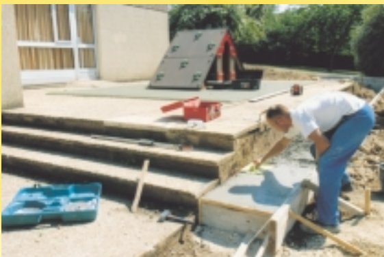
Gros travaux de clôture à l'école des Brizeaux cet été.

"Notre rôle est d'avoir une vision d'ensemble et si possible, de faire une prospective sur plusieurs années... Aussi suivons-nous de près tous les projets de construction de lotissements dans tel et tel quartier qui ont des retentissements directs sur les écoles. Même si nous ne pouvons pas présager du nombre d'enfants ni de l'âge des enfants qui habiteront ici et là... Quoi qu'il en soit, le nombre d'enfants scolarisés à Niort ne fléchit pas et nos chiffres sont beaucoup plus optimistes que les statistiques, partielles, du recensement !" ■