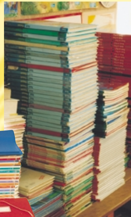
La mairie accorde un budget spécial à chaque école pour l'achat de fournitures et de petit matériel.

Autant de chaises que d'enfants et même beaucoup plus lorsqu'on compte les chaises des restaurants scolaires ! Tout ce mobilier n'a plus grand-chose à voir avec celui de notre enfance et que ce soit dans leur forme ergonomique ou dans les couleurs et les matériaux utilisés, chaises, tables et autres bibliothèques sont adaptées à nos enfants. Désormais, les tables se règlent en hauteur et sont souvent individuelles, les meubles des maternelles se font ludiques et le mobilier des restaurants scolaires a un revêtement anti-choc qui amortit les bruits ! Le budget "mobilier et matériel" atteignait 205 000 euros en 2005, réparti entre toutes nos écoles, et comprenant aussi du matériel audiovisuel. ■