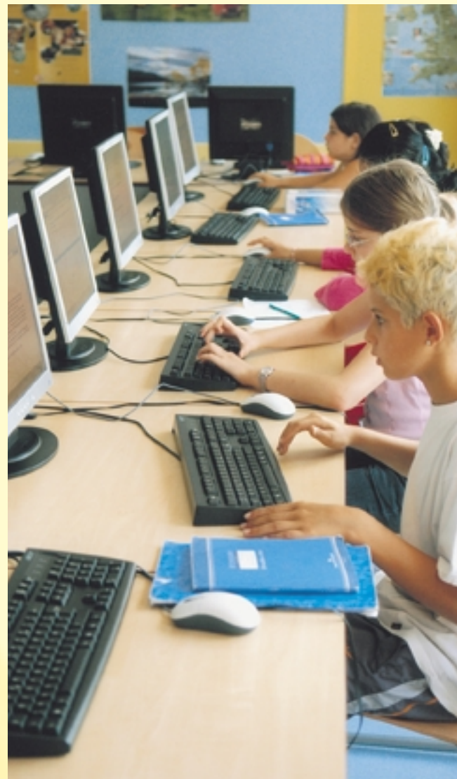
Apprentissage de l'anglais, histoire, géographie, rédaction ou navigation sur internet : les possibilités sont immenses...