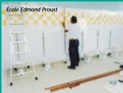
Ecole Edmond Proust

ZOLA MATERNELLE ▶ Peinture et sol de 2 classes. ELEMENTAIRE ▶ Remplacement de stores électriques, réfection entrée et clôture de la cour.