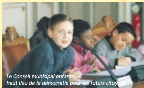
Le Conseil municipal enfants, haut lieu de la démocratie pour les futurs citoyens