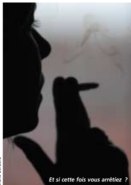
Et si cette fois vous arrêtez ?

• Rens. et inscriptions au Centre d'examens de santé et de prévention de la CPAM, 110 avenue de Limoges, tél. 05 49 04 46 60.