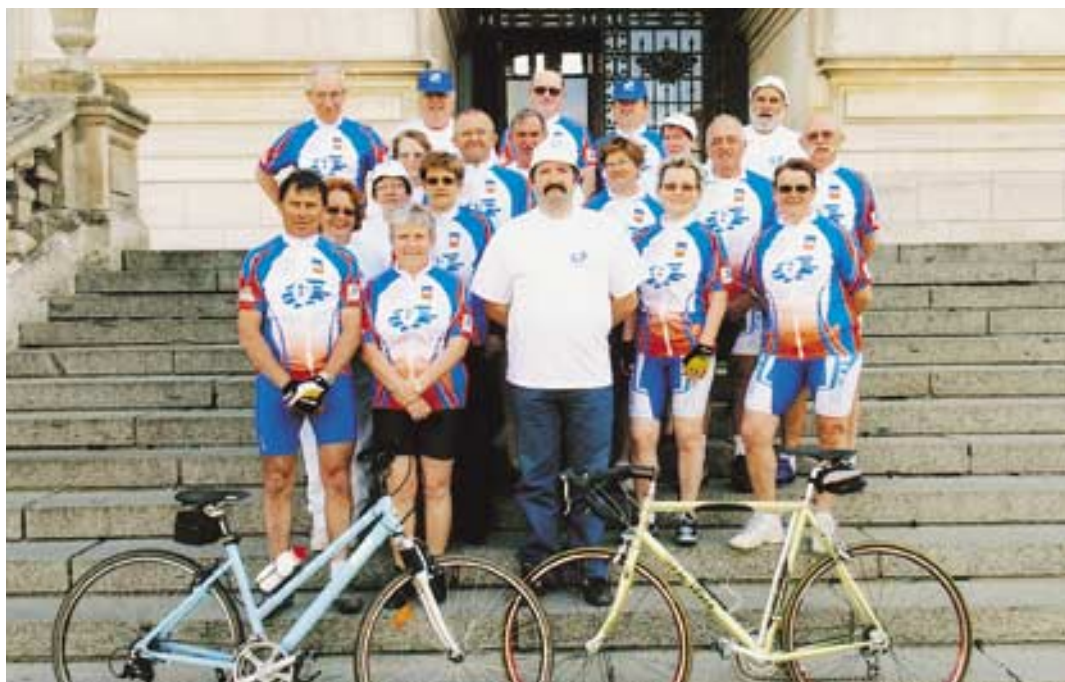
Vingt et un adhérents de l'Adot, greffés ou donneurs d'organes, vont rallier Niort à Saint-Jacques-de-Compostelle à pied ou à vélo.

C'est en 1969 qu'a germé en lui l'idée de créer cette structure qui compte aujourd'hui 2 600 adhérents. Son frère Jean est alors très malade : il a besoin d'un rein. En lui faisant cadeau de la vie, Yves s'engage sur une route qu'il ne quittera plus jamais. Une route semée de joies, mais aussi de luttes contre la mort. "Même si une simple phrase sur une carte de visite suffit, rares sont ceux qui ont pris une décision de leur vivant. Alors, lorsque le décès survient, le médecin se voit contraint de demander à des proches sous le choc de prendre position". Pourtant une loi de bio éthique de 1994, reprise par la loi Caillaudet, stipule clairement : "Toute personne majeure est supposée consentante au prélèvement d'or-