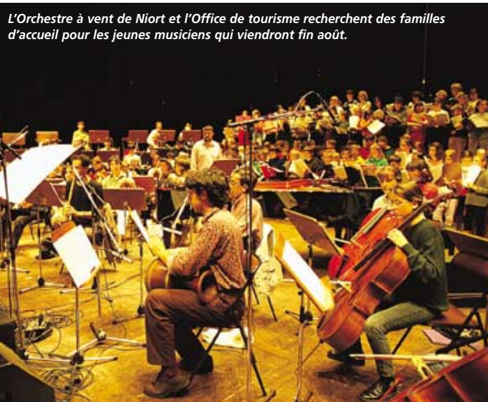
L'Orchestre à vent de Niort et l'Office de tourisme recherchent des familles d'accueil pour les jeunes musiciens qui viendront fin août.

• Rens. Office de tourisme, tél. 05 49 24 18 79.