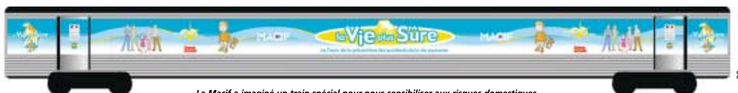
La Macif a imaginé un train spécial pour nous sensibiliser aux risques domestiques.

Renseignements : www.macif.fr , rubrique Prévention.