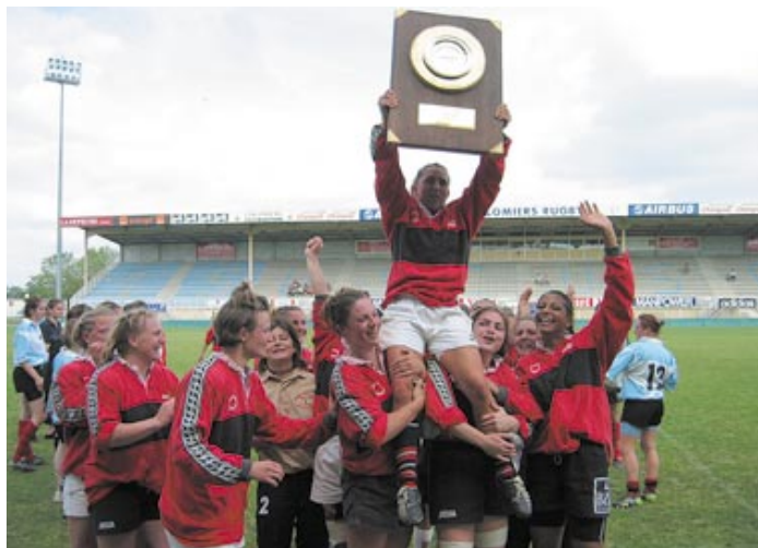
Cinq finales vont avoir lieu à Niort dont celle... de ces demoiselles.