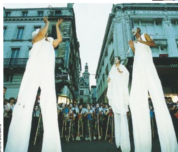
En 2003, "Dé en bulles" de la Compagnie Volubilis et des enfants avait conquis le public.

Des écoliers motivés et heureux de rencontrer des artistes.