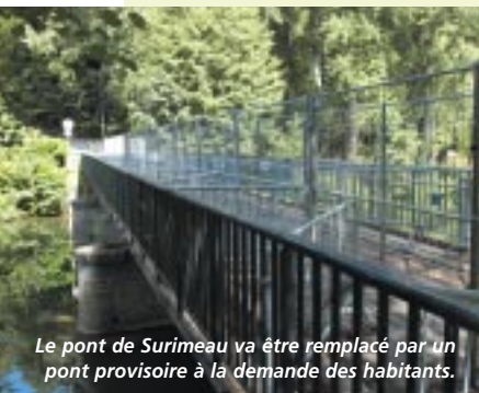
Le pont de Surimeau va être remplacé par un pont provisoire à la demande des habitants.

A u printemps dernier, les services municipaux ont découvert un état de corrosion très avancé des trottoirs et des poutrelles porteuses du pont de Surimeau. Saisi pour expertise, un bureau d'études avait conclu à un risque élevé de rupture de l'ouvrage et préconisé sa fermeture en juin 2004. La circulation est toutefois maintenue pour les piétons et les cyclistes. Mais cette situation perturbant fortement les habitants du quartier et pénalisant les commerçants de Sainte-Pezenne, la municipalité a décidé de réunir tous les usagers dans une réunion publique. D'autant que le remplacement à neuf du pont actuel ne peut être envisagé avant l'été 2006. Les riverains ont donc lar-