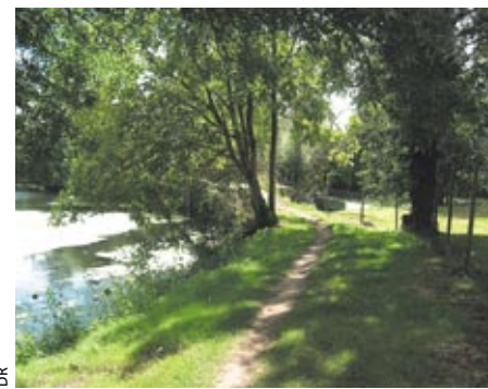
Les travaux prévoient de consolider les berges, très érodées.