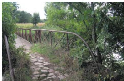
Les petites passerelles, comme ici à la Géôle, vont être rénovées.

Aujourd'hui, toutes les acquisitions ayant été faites, de Comporté à l'entrée de Magné, la Ville relance ses travaux. C'est sur la "vieille Sèvre", à l'arrière du quai de Belle Ile, entre les passerelles rouges, qu'un chemin va être créé. Serpentant entre le canal de Belle-Ile et la Sèvre, ce petit chemin nous permettra d'aller plus avant dans nos promenades. Et de rallier la Cale du Port au Pont de la Belle Etoile. Des travaux de protection des berges, dégradées notamment par les ragondins, seront aussi réalisés. Puis le chantier se déplacera sur le tronçon entre le Pont de la Belle Etoile et les Chizelles : création d'une pente douce du chemin vers la rivière (actuellement, la pente est abrupte), réalisation d'un chemin, plantation d'arbres, d'arbustes et de plantes de berge comme les iris.