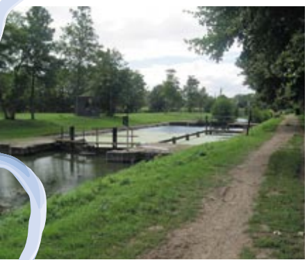
L'écluse de la Tiffardière.

chemins que nous sommes si heureux de parcourir à pied ou à vélo. Dans le cas où ces terrains étaient agricoles et dévolus à l'élevage, le projet de la Coulée verte prévoit la pose d'une clôture et l'installation d'abreuvoirs pour permettre aux animaux de boire ailleurs que dans la rivière... Il s'agit aussi de permettre à tout le monde de se côtoyer en harmonie : les promeneurs, les cyclistes, les pêcheurs, les coureurs ou encore... nos amies les vaches, parfois trop pressées pour certains !