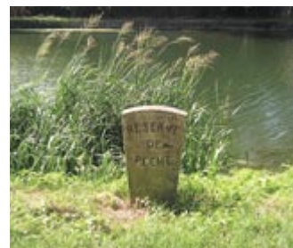
Rappelons que la Sèvre niortaise est l'une des rivières les plus poissonneuses de France.

Souvenez-vous, la Coulée Verte a déjà considérablement changé notre approche de la Sèvre et le paysage de ses abords dans le centre-ville. Les premiers travaux réalisés