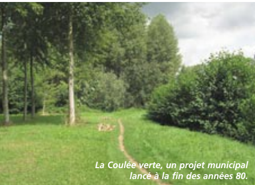
La Coulée verte, un projet municipal lancé à la fin des années 80.

Lancé à la fin des années 80, le projet de reconquête de notre rivière, baptisé "Coulée verte" va entrer dans une nouvelle phase à partir de ce mois de février. Une étape qui va permettre de gagner de