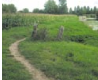
A pied ou à vélo, en flânant ou en courant.

particularité de son milieu et des espèces protégées qui y vivent. Par conséquent, l'équipe qui sera choisie par la Ville comprendra nécessairement un écologue, spécialiste des questions environnementales. La municipalité veut en outre mettre