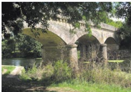
La Coulée verte passe sous le pont de chemin de fer à Saint-Liguaire.

Un projet qui comprend également un gros travail d'acquisition foncière, que la Ville a dû mener en parallèle aux travaux proprement dits. Pas moins de 400 propriétaires en effet se partageaient quelque 200 parcelles en bord de Sèvre ! Des parcelles qu'il a donc fallu acheter pour permettre la création de ces petits