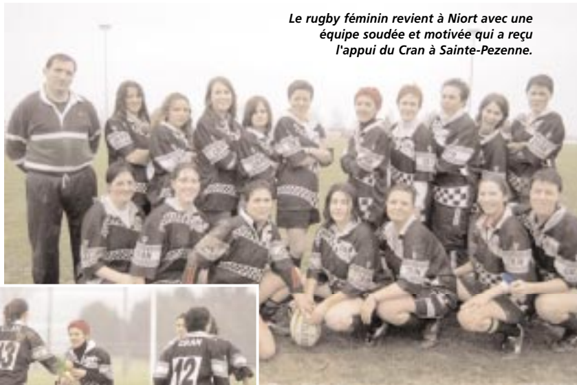
Le rugby féminin revient à Niort avec une équipe soudée et motivée qui a reçu l'appui du Cran à Sainte-Pezenne.

En juin dernier, les deux Niortaises reçoivent un accueil très chaleureux du Cran de Sainte-Pezenne qui les prend sous son aile et leur propose un créneau pour les entraînements. Les rugbywomen bénéficient également du soutien sans faille du Comité régional du rugby, qui à titre exceptionnel pour la première année prend en charge la moitié du coût de la licence. Joli coup de pouce de la fédération française de rugby, qui souhaite ainsi développer le rugby féminin dans l'Hexagone, qui compte seulement une quarantaine d'équipes.