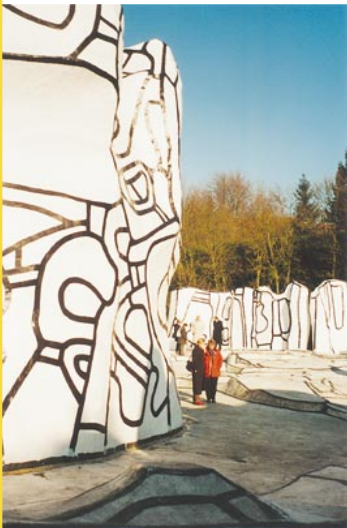
Les Amis des arts se retrouvent régulièrement pour des visites, ici à la villa Falbala, une création de Jean Dubuffet.

"Ces conférences de rentrée attirent beaucoup de monde. Car c'est intéressant de préparer ou d'approfondir la visite des grandes expositions qui font l'actualité culturelle en France."