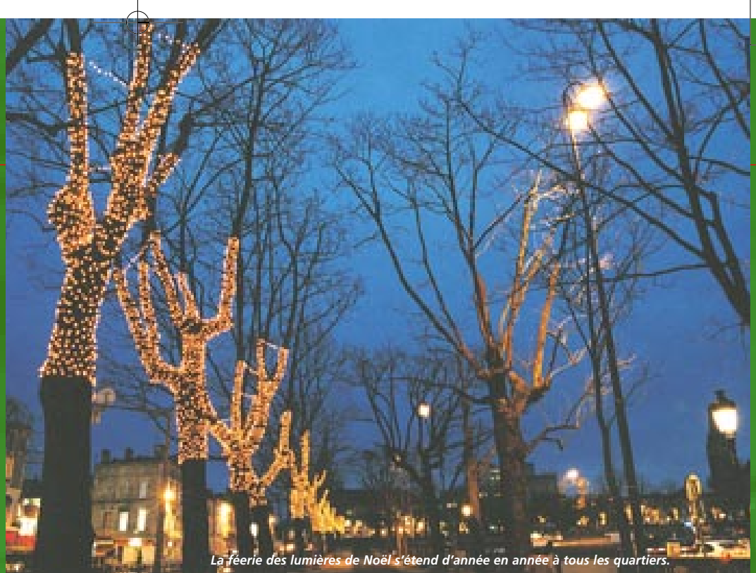
La féerie des lumières de Noël s'étend d'année en année à tous les quartiers.