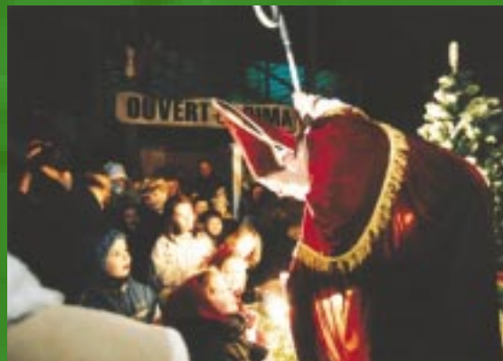
Saint Nicolas, samedi 11 décembre, départ à 17h du placis des Halles et arrivée à 18h30 au même endroit.

C' est devenu une tradition héritée de nos voisins allemands : samedi 11 décembre, Saint Nicolas fera son entrée à Niort, tout de blanc et rouge vêtu, dans une calèche tirée par deux chevaux. Entouré de petits artifices de rue en étoile verts et rouges, il distribuera bonbons et pain d'épices dans les rues du centre-ville. Départ à 17h du placis des Halles pour un retour à 18h30. ■