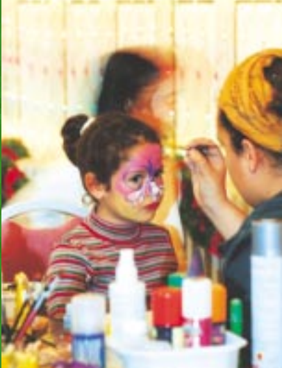
Espace enfants, salle de Justice de paix de la mairie, les 11, 12, 18 et 19 décembre. Distribution de jouets et spectacle le dernier jour.