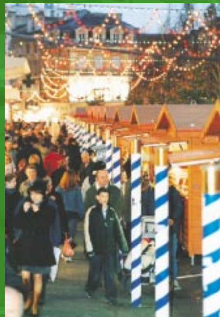
Les chalets du marché des saveurs et des artisans d'art nous attendront rue Victor-Hugo.

Les chalets du marché de Noël ouvriront le 4 décembre sur la Brèche.