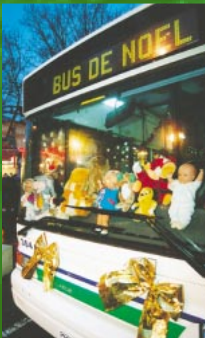
Les TAN collecteront les jouets dans un bus spécial en bas de la Brèche.

C' est la rançon du succès : pendant le marché de Noël, le stationnement voire la circulation seront un peu compliqués. Particulièrement le week-end. Plutôt que de vous retrouver coincé dans un embouteillage et de vous énerver dans votre voiture, pourquoi ne pas utiliser le bus ? D'autant qu'ils seront gratuits les dimanches 12 et 19 décembre. C'est en plus une bonne solution pour participer à la préservation de l'environnement et... de notre santé. En plus, les TAN ont décidé de jouer au Père Noël eux aussi et collecteront jouets et cadeaux pour les plus défavorisés dans un bus spécialement installé en bas de la Brèche, les samedis 11 et 18 décembre. ■