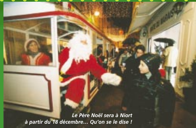
Le Père Noël sera à Niort à partir du 18 décembre... Qu'on se le dise !

Du 10 au 24 décembre, tous les jours de 10 h à 12 h et de 14 h à 19 h, le petit train électrique de Noël permet d'aller d'un point à un autre ou de flâner dans les rues sans se fatiguer. C'est entièrement gratuit. Et figurez-vous que même le Père Noël l'utilise ! ■