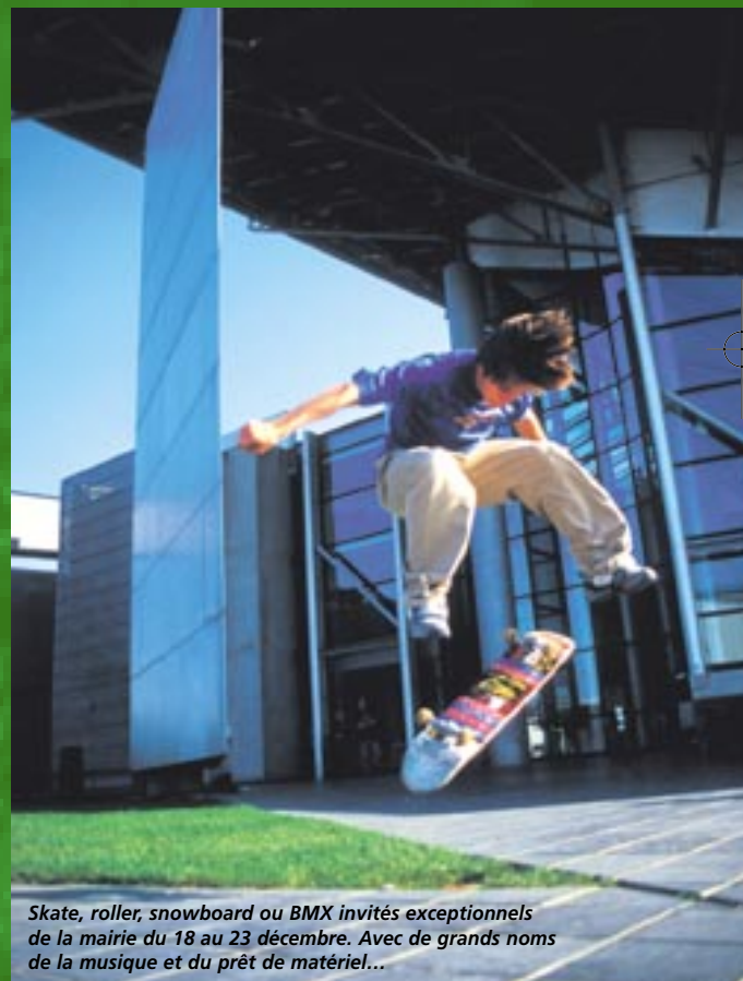
Skate, roller, snowboard ou BMX invités exceptionnels de la mairie du 18 au 23 décembre. Avec de grands noms de la musique et du prêt de matériel...