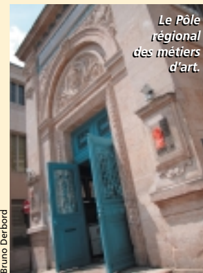
Le Pôle régional des métiers d'art.