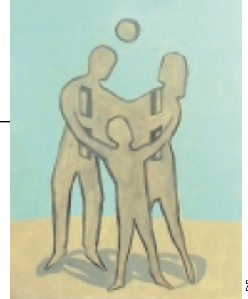
La fresque déployée sur 75 m 2 rue Jules-Siegfried.

Point d'orgue de cet anniversaire, une spectaculaire fresque de 75 m 2 déployée le 30 septembre sur la façade