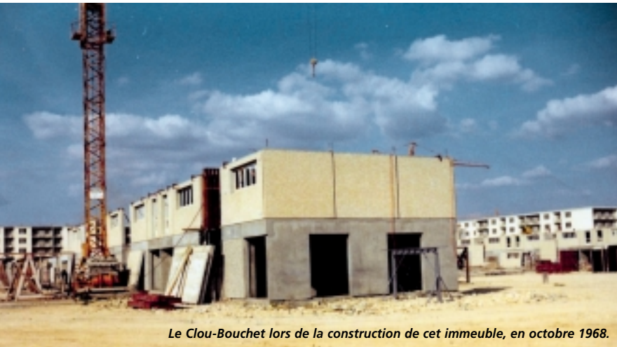
Le Clou-Bouchet lors de la construction de cet immeuble, en octobre 1968.

Depuis le 30 septembre, l'Opac fête ses 80 ans. Pour l'occasion, une fresque de 75 m 2 vient d'être déployée sur un immeuble du Clou-Bouchet. Une série d'événements va avoir lieu jusqu'à la fin novembre.