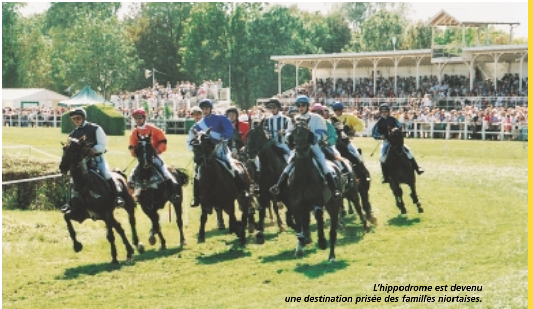
L'hippodrome est devenu une destination prisée des familles niortaises.

Une centaine de chevaux, venus de Pau, de Paris ou de Bretagne, viennent s'aligner au départ, à raison de quatre réunions par an. Avec pas moins de trois pistes (plat, trot et obstacles), le site a indéniablement de quoi séduire les entraîneurs et leurs cracks, d'autant qu'il est parfaitement entretenu puisque partagé avec le golf. La piste de plat, avec