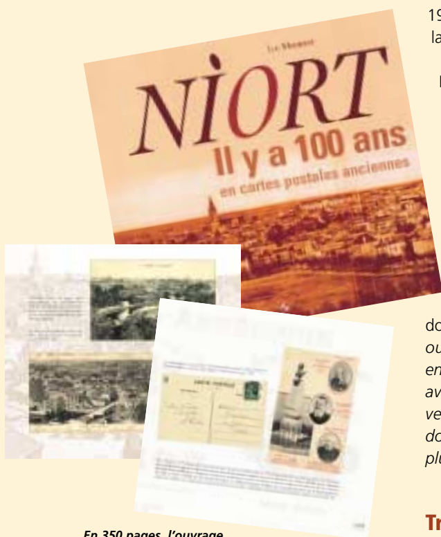
En 350 pages, l'ouvrage Niort il y a 100 ans apporte un précieux témoignage de la vie à Niort au début du XX e siècle.

Le livre Niort il y a 100 ans, que publie cet automne Luc Monteret aux Editions Patrimoines et médias, nous offre, en 350 cartes postales anciennes, un témoignage de la vie à Niort au début du XX e siècle.