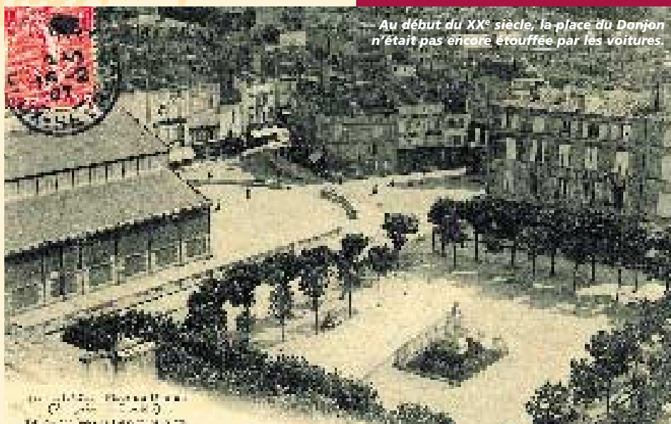
Au début du XX e siècle, la place du Donjon n'était pas encore étouffée par les voitures.

Niort il y a 100 ans, chez Patrimoines et médias (distributeur : Geste éditions), en librairies. Le 3 déc. à 18 h à l'Hôtel de Ville, la vente sur place ira au bénéfice de l'association Vaincre la mucoviscidose.