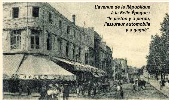
L'avenue de la République à la Belle Époque : "le piéton y a perdu, l'assureur automobile y a gagné".