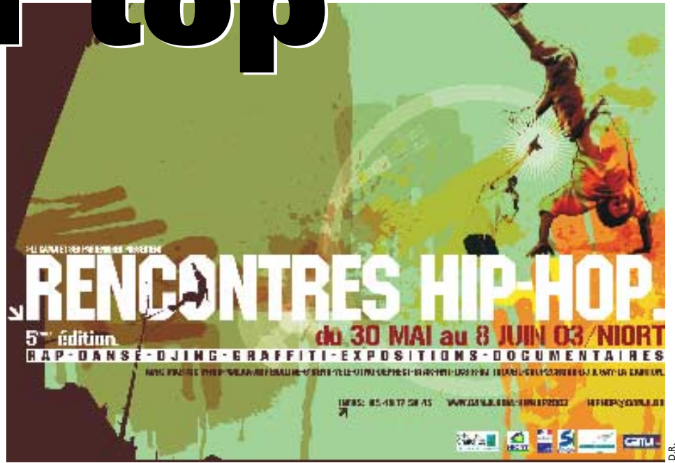
Du 30 mai au 8 juin, Niort va vivre au rythme du hip-hop.

Quant aux compagnies Yélé, également de Niort, et S'Sens, de La Roche-sur-Yon, elles reviennent cette année tout auréolées de leur