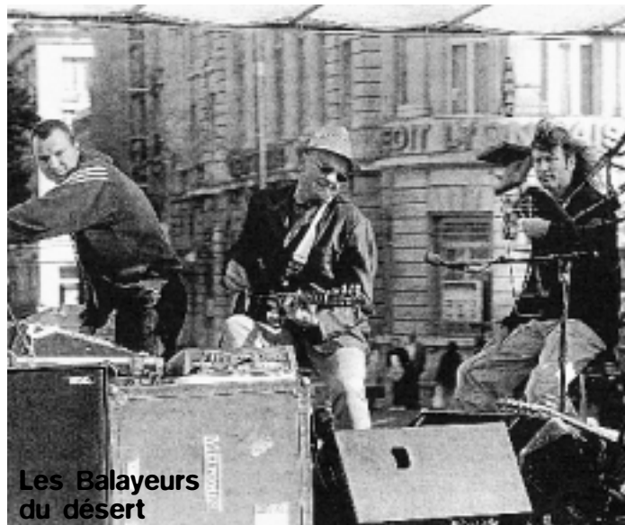
Les Balayeurs du désert

Les Balayeurs du désert, tout droit venus de Marseille, ont déjà joué au FJT La Roulière. Ils sont devenus les musiciens attirés de la compagnie Royal de Luxe. C'est dire s'ils sont bons ! "Ils ont un côté Lojo Triban vraiment plaisant. C'est une musique associée à la rue et leurs inspirations sont très méditerranéennes. C'est un groupe réellement à l'écoute de ce qui se fait autour d'eux et qui sait s'en inspirer."