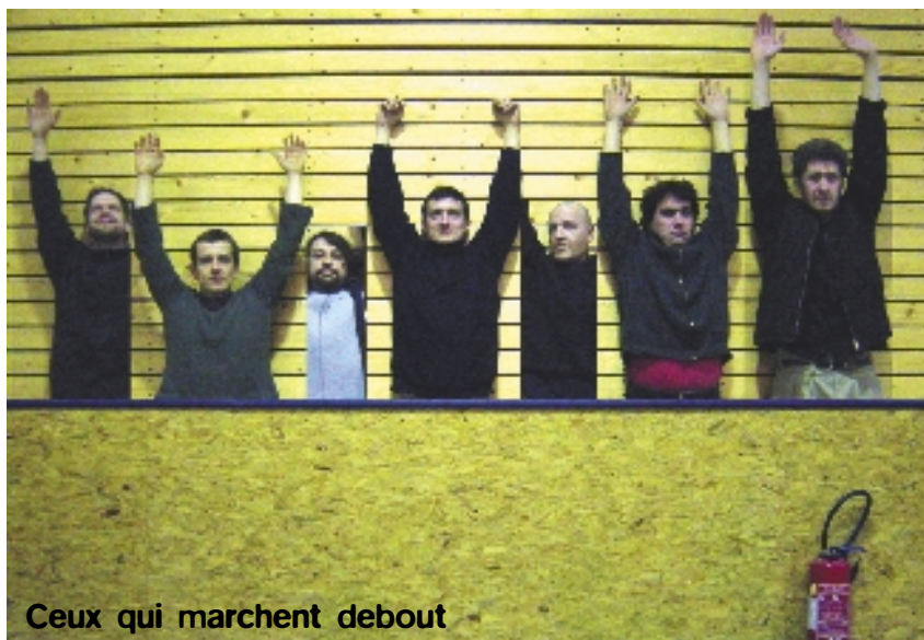
Ceux qui marchent debout

En première partie : Dahlia, "un duo qui nous avait impressionnés aux Transmusicales de Rennes." Ce groupe prometteur et touche-à-tout joue beaucoup avec les machines pour un résultat percutant et étonnant.