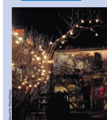
Les dentelles de lumière de la maison des Guignard et Bonneau, avenue de Nantes, ont reçu le prix de la Ville de Niort.