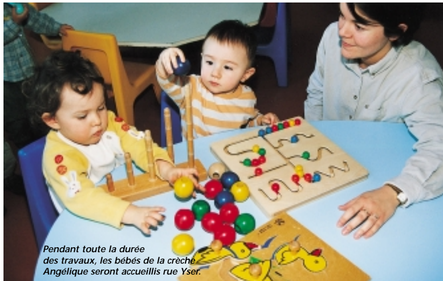
Pendant toute la durée des travaux, les bébés de la crèche Angélique seront accueillis rue Yser.