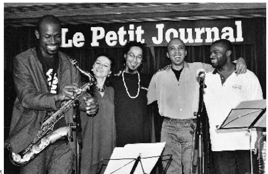
Le Conseil municipal soutient les manifestations d'été...