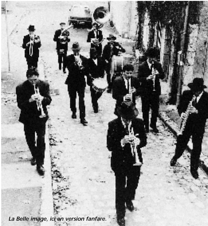
La Belle image, ici en version fanfare.