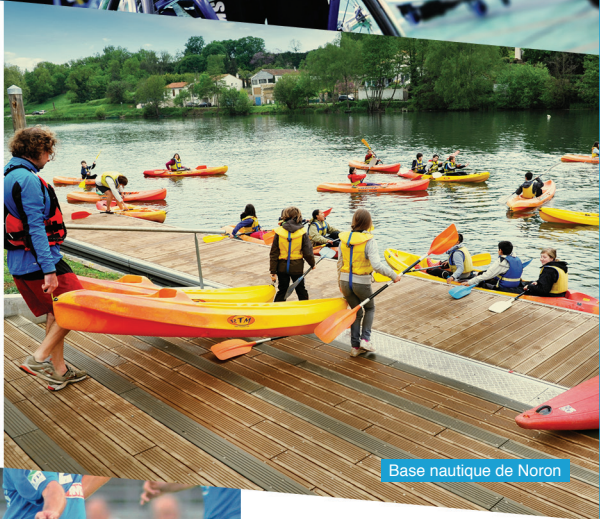
Base nautique de Noron

En partenariat avec les associations, la Ville propose des animations de découverte pour les jeunes et des ateliers pour les seniors, favorise la pratique sportive des personnes en situation de handicap... La Fédération française handisport lui a décerné en 2013 le « Trophée de la ville de l'année ».