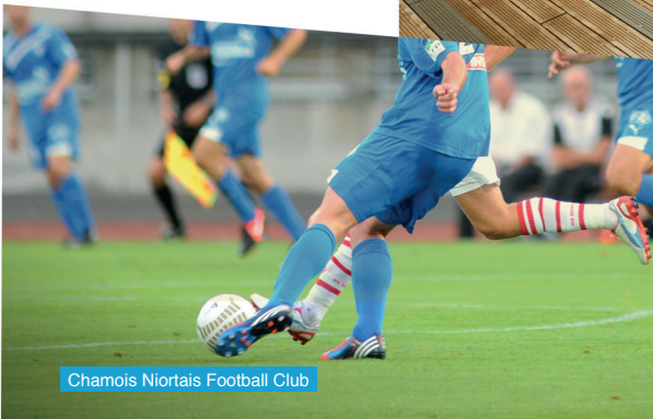
Chamois Niortais Football Club

Niort soutient aussi les clubs de haut niveau, comme le Chamois Niortais Football Club, le Stade Niortais Rugby ou encore le Volley-Ball Pexinois Niort, qui tous contribuent à la notoriété de la ville.