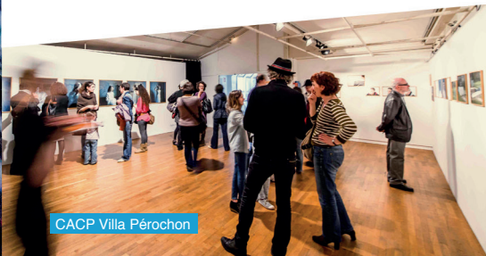
CACP Villa Pérochon