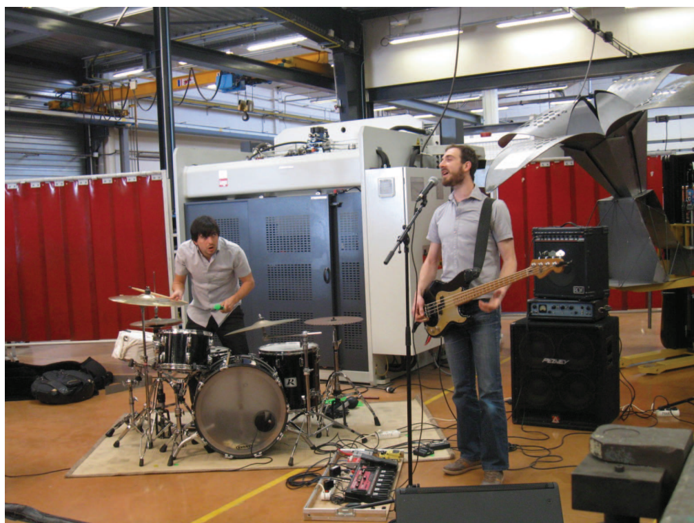
Le groupe Paradot dans les ateliers du Lycée Paul Guérin