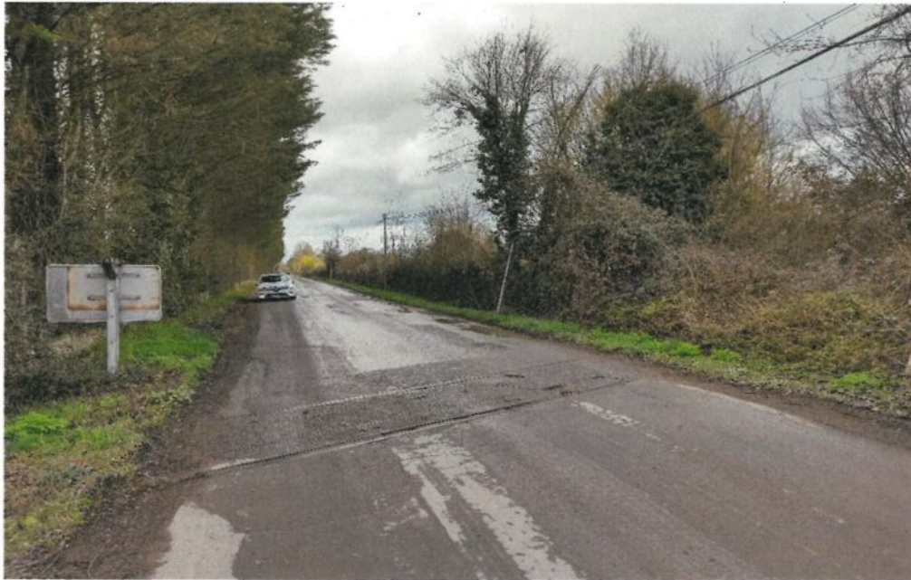
Situation du PN 337,