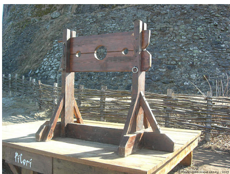
Pilori de type « carcan »

Le Pilori est un support sur lequel ou auquel on attachait les condamnés à l'exposition publique . Peine qui répondait à un double objectif : humilier le condamné et servir d'exemple à l'ensemble de la population.