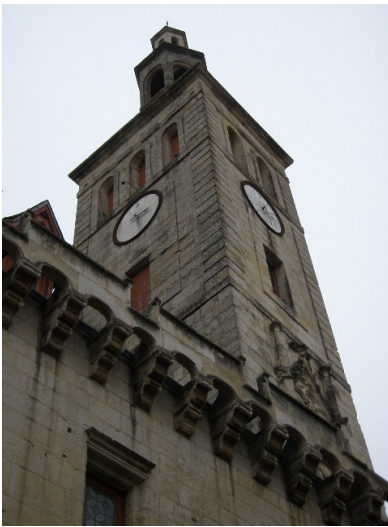
Beffroi du XIVe siècle

1380 : construction du second Hôtel de Ville en lieu et place du Pilon médiéval . C'est pour cette raison que le bâtiment conservera au cours des siècles le nom de Pilon.