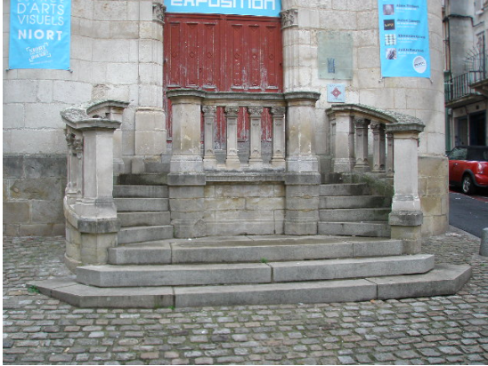
Escalier à deux rampes du XIXe siècle

Fin XIXe : campagne de restauration par l'architecte Juste Lisch. Construction du clocher au sommet du beffroi, de l'escalier à 2 rampes à l'entrée du bâtiment et peintures de la grande salle au premier étage.