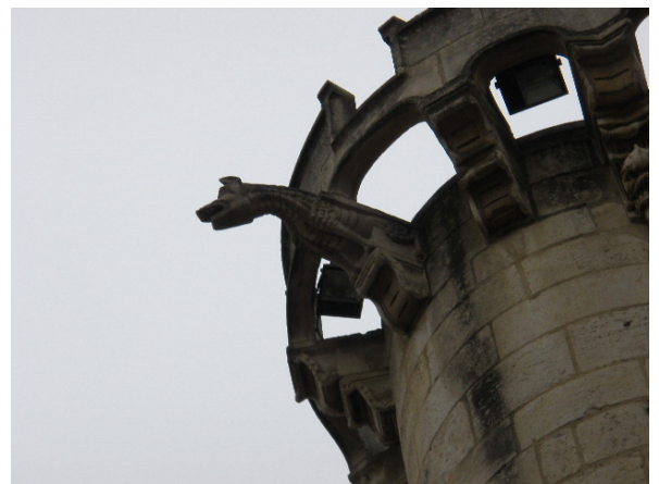
Détail tour (gargouille + créneaux décoratifs)

Mathurin Berthomé donne à l'édifice une architecture de type Renaissance tout en conservant les caractéristiques des forteresses médiévales (tours semi-circulaires, créneaux, gargouilles...) .