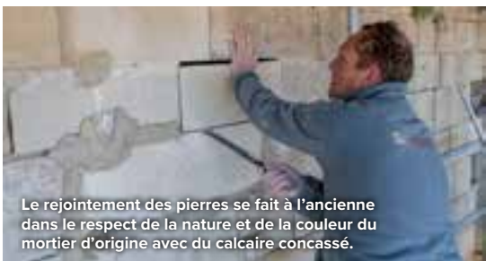
Le rejointement des pierres se fait à l'ancienne dans le respect de la nature et de la couleur du mortier d'origine avec du calcaire concassé.