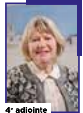
4 e adjointe

Chargé de l'éducation, de la jeunesse et de l'égalité des chances.