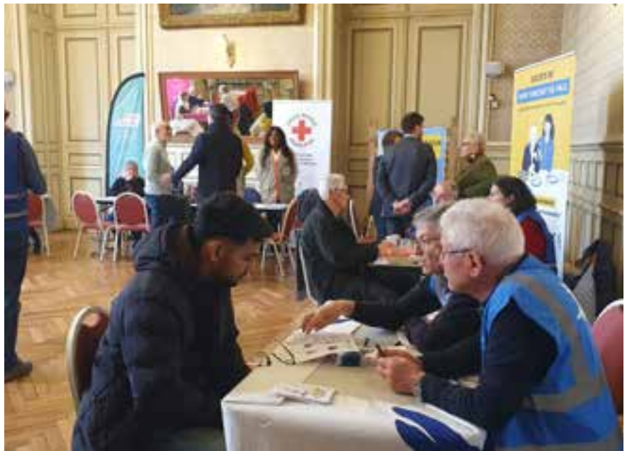
Ville de Niort

N ombreux sont celles et ceux qui souhaitent se rendre utiles, agir pour les autres et participer à la solidarité locale, sans toujours savoir par où commencer. Le Forum du bénévolat a justement pour vocation de faciliter ce premier pas, en créant un espace d'échange direct entre habitants et associations. Une rencontre, une discussion, et l'envie d'aider peut rapidement se transformer en engagement. Les besoins sont nombreux et les formes d'implication très variées : participation aux maraudes, aide aux