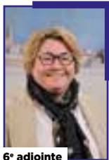
6 e adjointe

Chargé des quartiers, de la politique de la Ville et de la vie participative et de la coopération citoyenne.