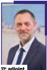
11 e adjoint

Chargée des affaires générales, de l'état civil et de l'efficacité des services publics municipaux.