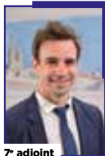
7 e adjoint

Chargée de la sécurité et de la tranquillité publiques.