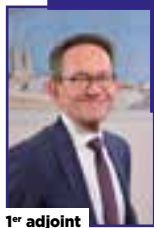
1 er adjoint