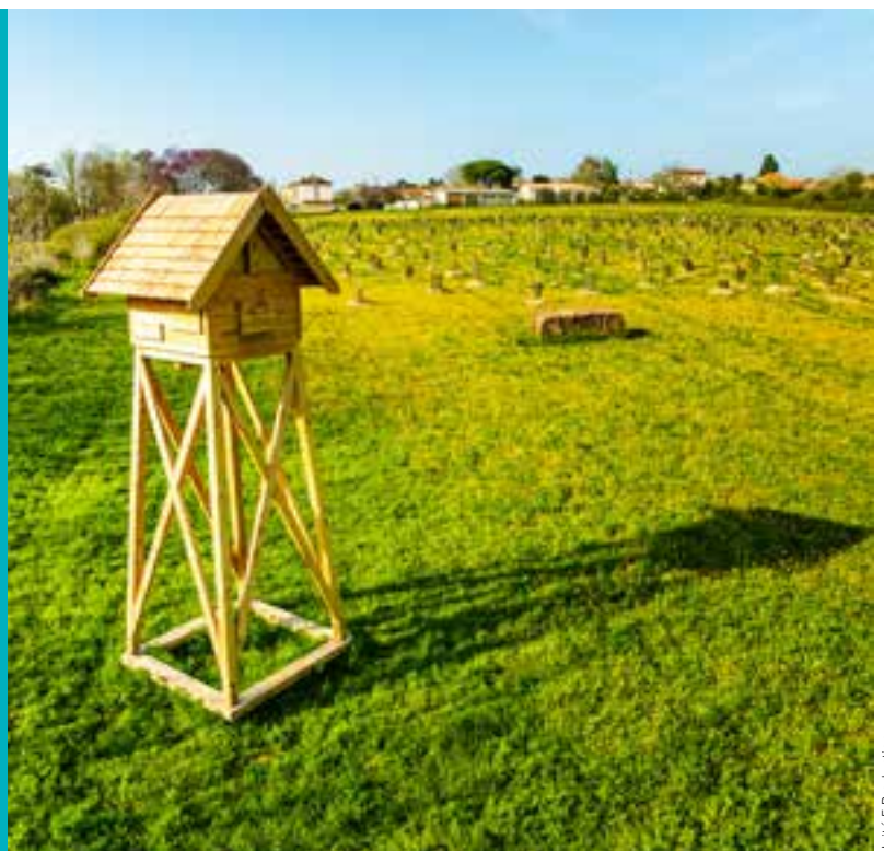
Unité 5 Production

Retrouvez la vidéo de la tour à chauves-souris sur Niort TV en scannant ce QR code