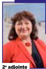
2 e adjointe

Chargé de la qualité de l'espace public, de la gestion durable du patrimoine et de la performance énergétique.