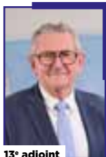
13 e adjoint

Chargée de l'habitat, du logement et de la valorisation du patrimoine historique.