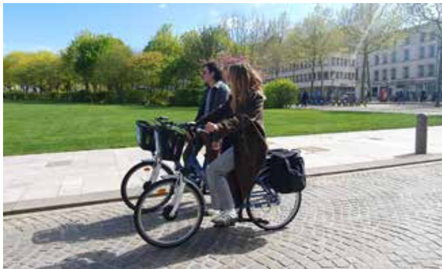
Ville de Niort

Niort Agglo et Transdev, opérateur du réseau tanlib, participent à l'opération nationale Mai à vélo, destinée à promouvoir la pratique du vélo auprès du grand public. Tout au long du mois, plusieurs rendez-vous viendront rappeler l'enjeu croissant des mobilités douces sur le territoire.