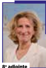
8 e adjointe

Chargé de la transition écologique, de l'urbanisme durable et des énergies renouvelables.