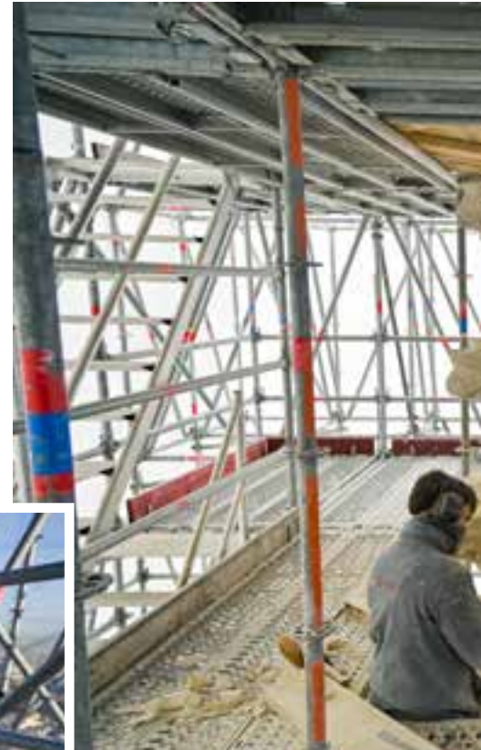
Taillée à l'ancienne, à la main par les compagnons de l'entreprise Somebat, la pierre sommitale est une création originale pour l'église Notre-Dame qui a retrouvé son fleuron disparu depuis le début du XIX e siècle. Il mesure 77 cm de haut et 62 cm de diamètre.

La 2 e tranche démarrera en juin et concernera la restauration du clocher avec l'intervention de restaurateurs-conservateurs de pierres sculptées à environ 40 mètres en haut. À partir des croquis de restitution de l'Architecte du Patrimoine, ils travailleront sur les statues, dont ils compléteront les fragments manquants, les gargouilles et autres décorations en pierre de ce remarquable édifice de style gothique. ●