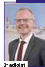
3 e adjoint

Chargée des solidarités, de la famille et du lien intergénérationnel. Vice-présidente du CCAS.