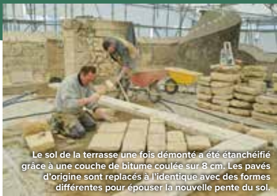
Le sol de la terrasse une fois démonté a été étanchéifié grâce à une couche de bitume coulée sur 8 cm. Les pavés d'origine sont remplacés à l'identique avec des formes différentes pour épouser la nouvelle pente du sol.

Depuis novembre 2025, l'entreprise locale Somebat restaure la tour nord en alliant méthodes traditionnelles et outils modernes. Un tailleur de pierre et deux apprentis, ainsi que trois maçons, œuvrent conjointement sur ce chantier qui s'achèvera en janvier 2027. Des menuisiers interviennent sur les fenêtres et la main courante de l'escalier, tandis que des métalliers réalisent les garde-corps de la terrasse. Un nouveau métier, celui d'étancheur, participe à la mise hors d'eau de l'ouvrage