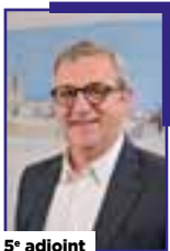
5 e adjoint

Chargée de la vie associative et du droit des femmes.