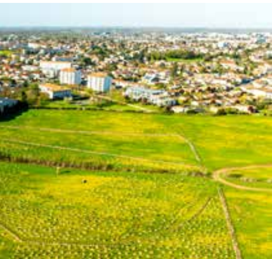
Unité 5 Production