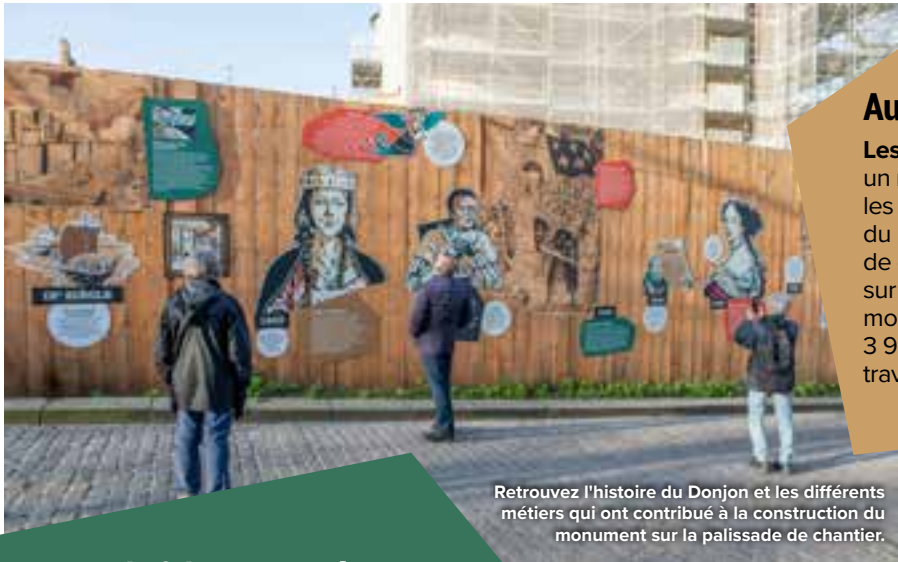
Retrouvez l'histoire du Donjon et les différents métiers qui ont contribué à la construction du monument sur la palissade de chantier.