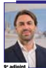
9 e adjoint

Chargée de la santé, des ressources humaines et du dialogue social.