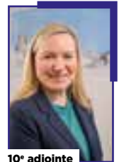
10 e adjointe

Chargé du commerce, de l'attractivité du centre-ville et des grands événements.