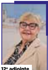
12 e adjointe

Chargé de la culture, de la ville créative et connectée.