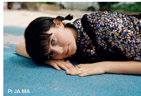
Pi JA MA