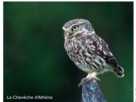
La Chevêche d'Athéna