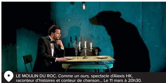
LE MOULIN DU ROC. Comme un ours, spectacle d'Alexis HK, raconteur d'histoires et conteur de chanson... Le 11 mars à 20h30.