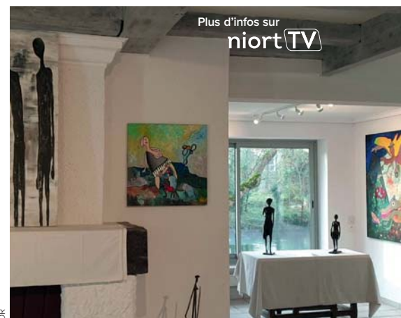
Plus d'infos sur niortTV

@ Plus d'informations sur www.galerie-desmettre.fr .