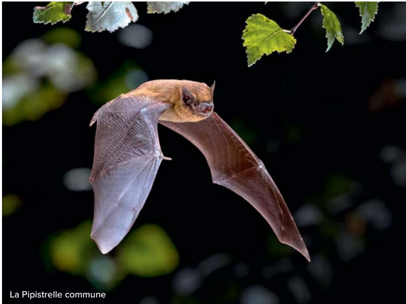
La Pipistrelle commune