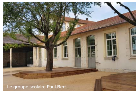
Le groupe scolaire Paul-Bert.

Autre chantier d'envergure : la cour de récréation du groupe scolaire Paul-Bert a été entièrement refaite avec un enrobé clair, qui renvoie moins de chaleur par temps chaud. Les deux grands arbres de la cour ont également fait l'objet d'un traitement : une terrasse en bois à hauteur des paliers de classes protège leurs racines qui peuvent désormais respirer et recevoir l'eau de pluie, sans constituer un danger pour les enfants. Des bancs ont été installés et des jeux tracés au sol.