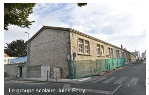
Le groupe scolaire Jules-Ferry.

La Ville de Niort intervient sur les espaces et équipements publics pour requalifier l'ensemble du quartier. En accordant une place importante à la végétalisation et aux mobilités douces, elle va réaménager le secteur Denfert-Rochereau, créer un square urbain traversant à l'arrière du centre socioculturel qui lui-même sera entièrement réhabilité