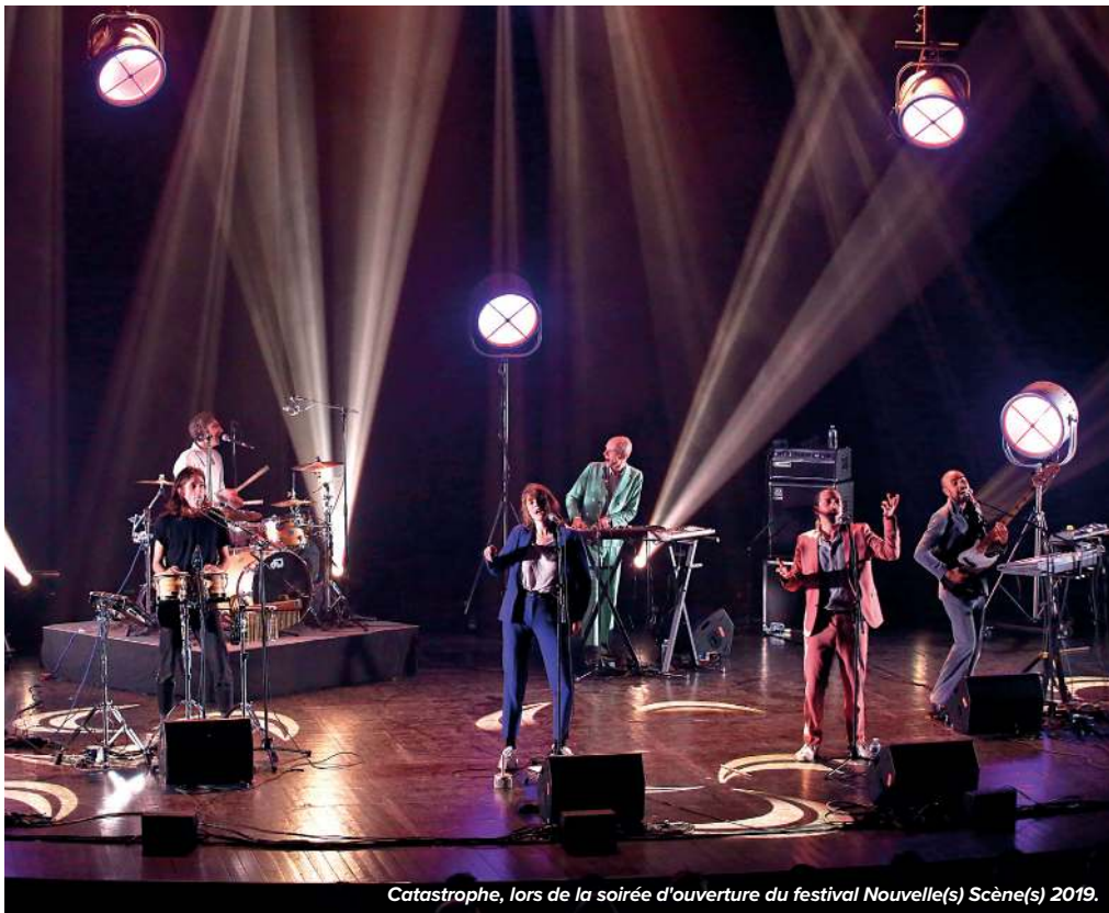
Catastrophe, lors de la soirée d'ouverture du festival Nouvelle(s) Scène(s) 2019.

Amateur de pop subtile ou de musique méchamment amplifiée, deux festivals aux sonorités diamétralement opposées connaissent le même succès.