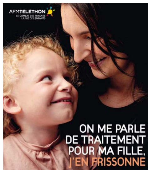
Oko / Cyrille Choupaïs

Samedi 9 décembre. La FNSEA organise une dégustation de produits locaux au profit du Téléthon. Sur son stand installé sur le parvis des Halles, on pourra déguster gratuitement des viandes des Deux-Sèvres (chevreau, agneau, bœuf et mouton) mais aussi des produits laitiers (fromages et fromages de chèvre, beurre...), des pommes et des jus de pommes. Sur le stand, une urne recevra vos dons au profit du Téléthon. ●