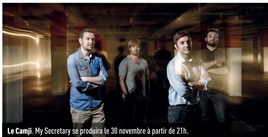
Le Camji. My Secretary se produira le 30 novembre à partir de 21h.