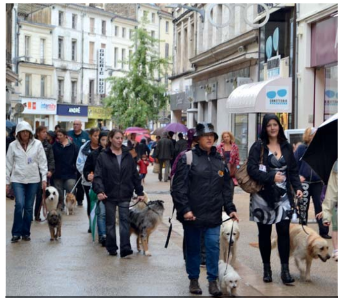
Dans le centre-ville, pour un exercice de bonne conduite, un jour d'affluence.