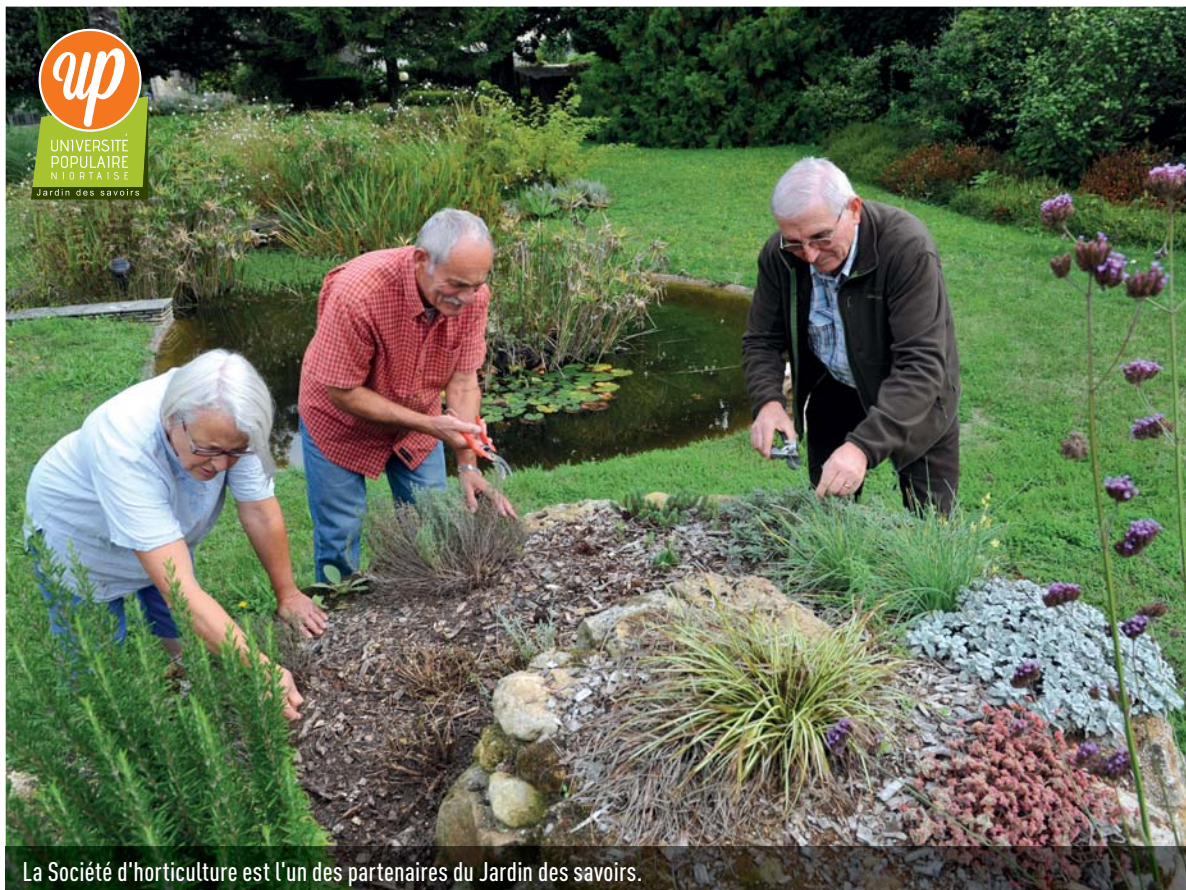
La Société d'horticulture est l'un des partenaires du Jardin des savoirs.

Plus d'informations sur : bit.ly/univpop