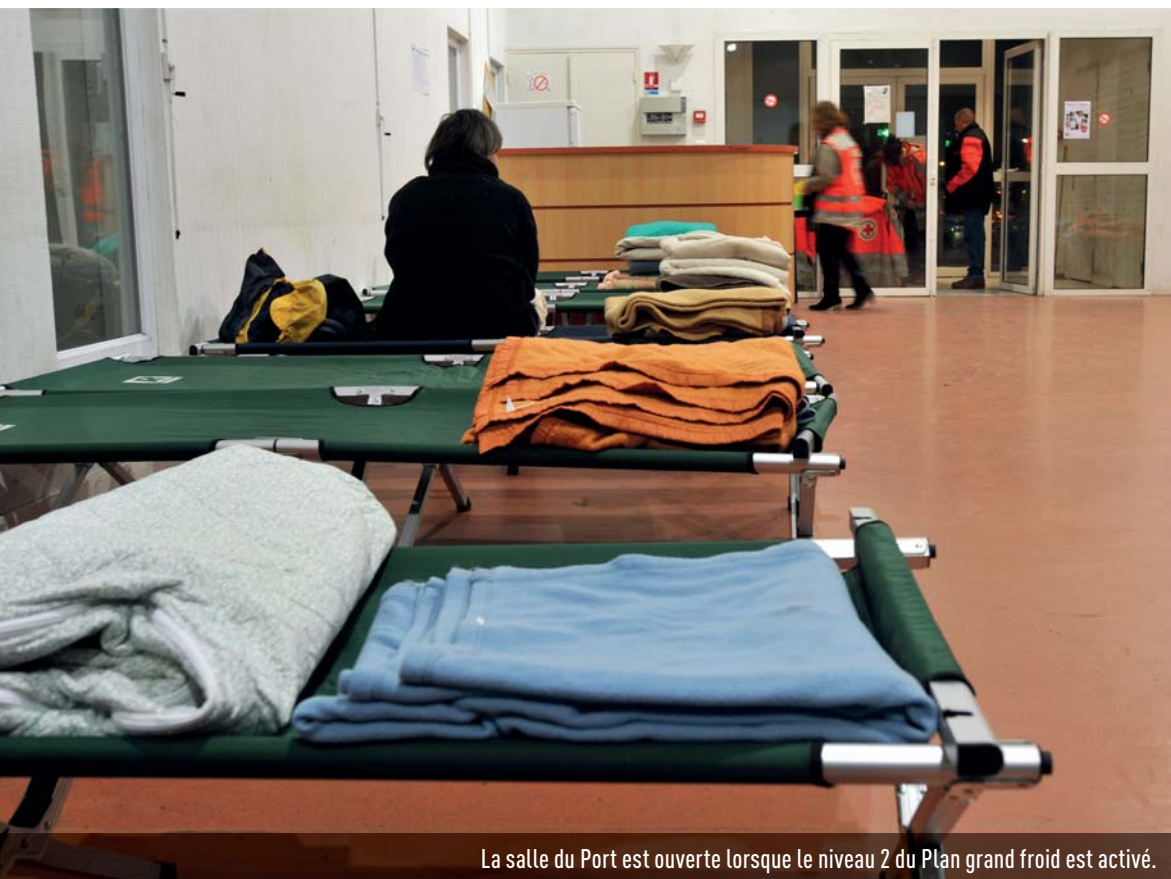
La salle du Port est ouverte lorsque le niveau 2 du Plan grand froid est activé.

➤ Pour signaler une situation d'urgence, composez le 115, le numéro vert du Samu social.