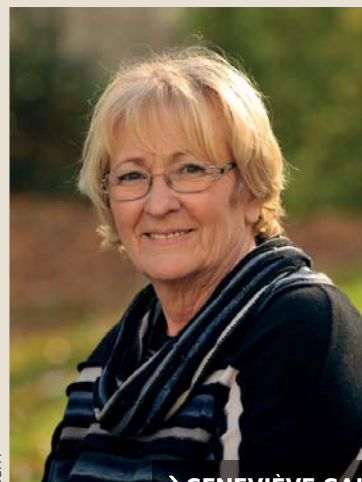
GENEVIÈVE GAILLARD Maire de Niort, députée des Deux-Sèvres

A quoi ressemblera notre ville demain ? Quelles problématiques aborder dès aujourd'hui pour construire une ville plus durable ? Eau, déchets, énergie, qualité de l'air, mobilité, informations, nouveaux services aux citoyens, santé publique, culture, lien social, ... : l'aménagement urbain durable doit intégrer de multiples innovations, technologiques bien sûr, mais pas seulement, car il doit aussi et avant tout répondre aux attentes de ses habitants.