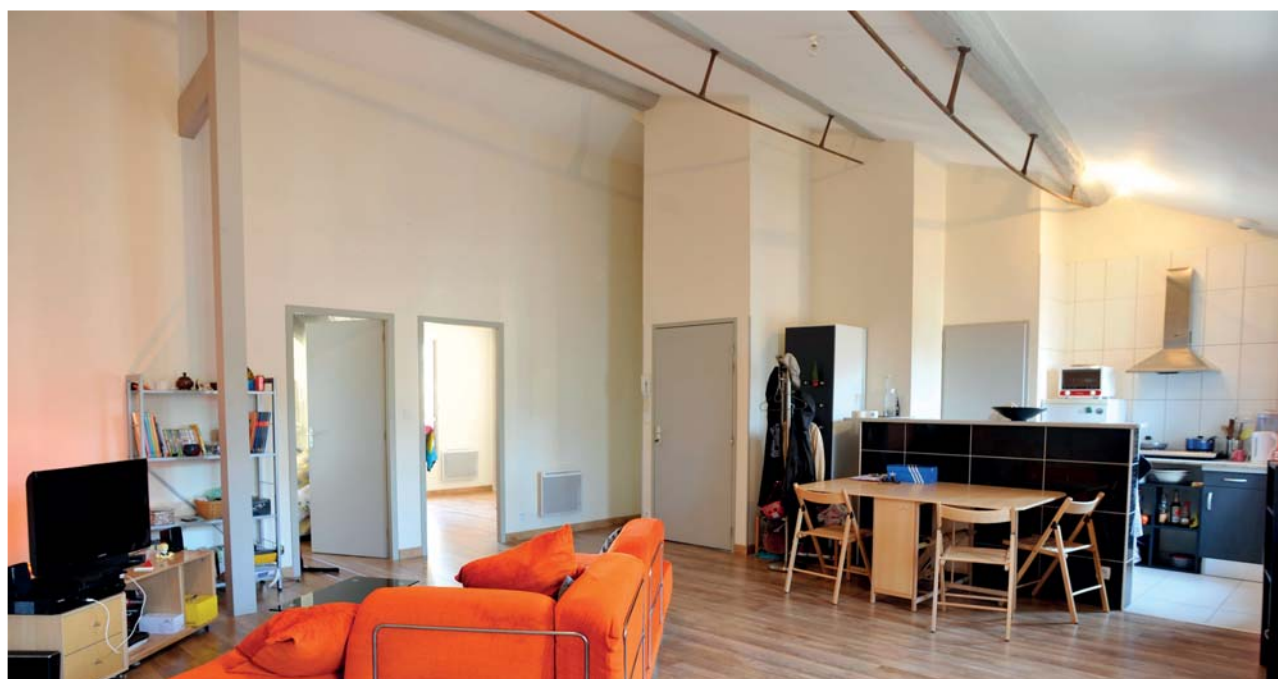
L'un des logements locatifs rénové en 2013 avec des aides de l'Opah.

Ce mois-ci, la maison de l'Opah change de look et devient tout simplement l'Opah. Mandaté par la Ville, le cabinet Urbanis y accueille toute personne souhaitant se renseigner sur l'opération programmée d'amélioration de l'habitat (Opah). Ce deuxième programme ( lire VAN N° 227 ) revoit à la hausse ses ambitions : il prévoit la rénovation de 180 logements locatifs et 260 logements de propriétaires occupants d'ici 2017. Plusieurs indicateurs montrent que la première phase d'investissement a permis de renforcer l'attractivité du centre-ville ( lire en encadré ). Une enquête de satisfaction a été réalisée en juin dernier auprès des différents bénéficiaires : locataires, propriétaires occupants et propriétaires bailleurs. Parmi ces derniers, plus de la moitié a acquis son bien pendant la première opération. Leur motivation principale ? investir pour l'avenir. Les aides de l'Opah ont été décisives dans le choix de réaliser des travaux. Ces propriétaires bailleurs sont très majoritairement satisfaits de l'accompagnement et du suivi d'Urbanis.