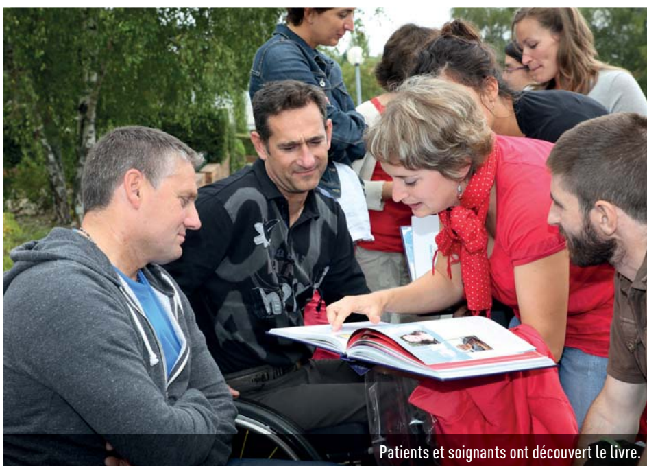
Patients et soignants ont découvert le livre.